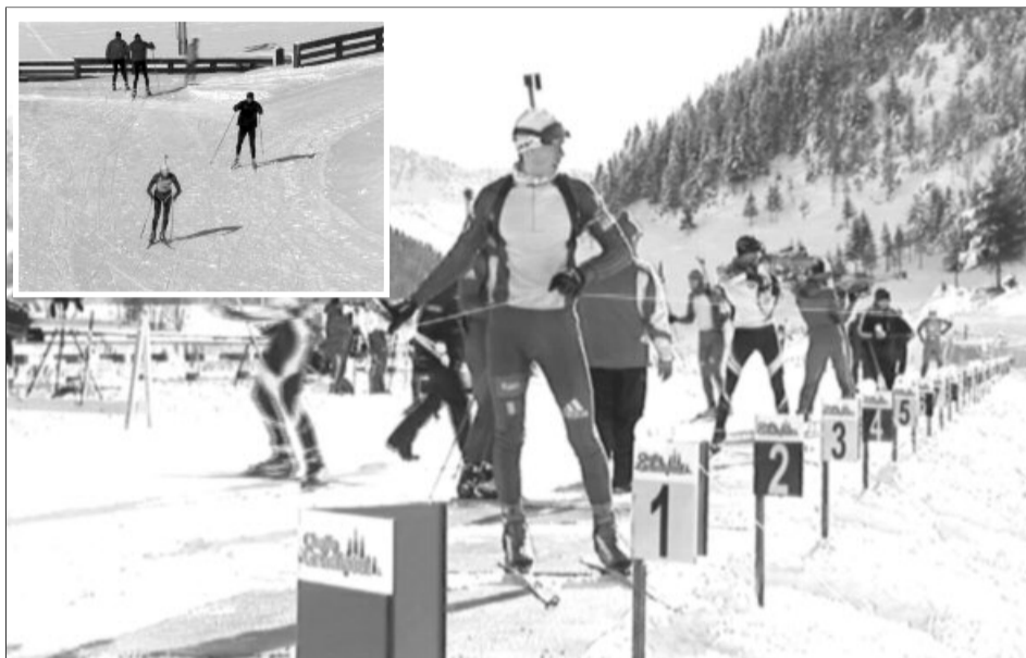
Consiliul Județean a alocat 800.000 de lei pentru implementarea proiectului „Brașov - Gazdă a JO de Tineret -2020”

„Este adevărat că nu este doar o acțiune a județului nostru, ci este națională, pentru că este susținută și de Comitetul Olimpic Sportiv Român”