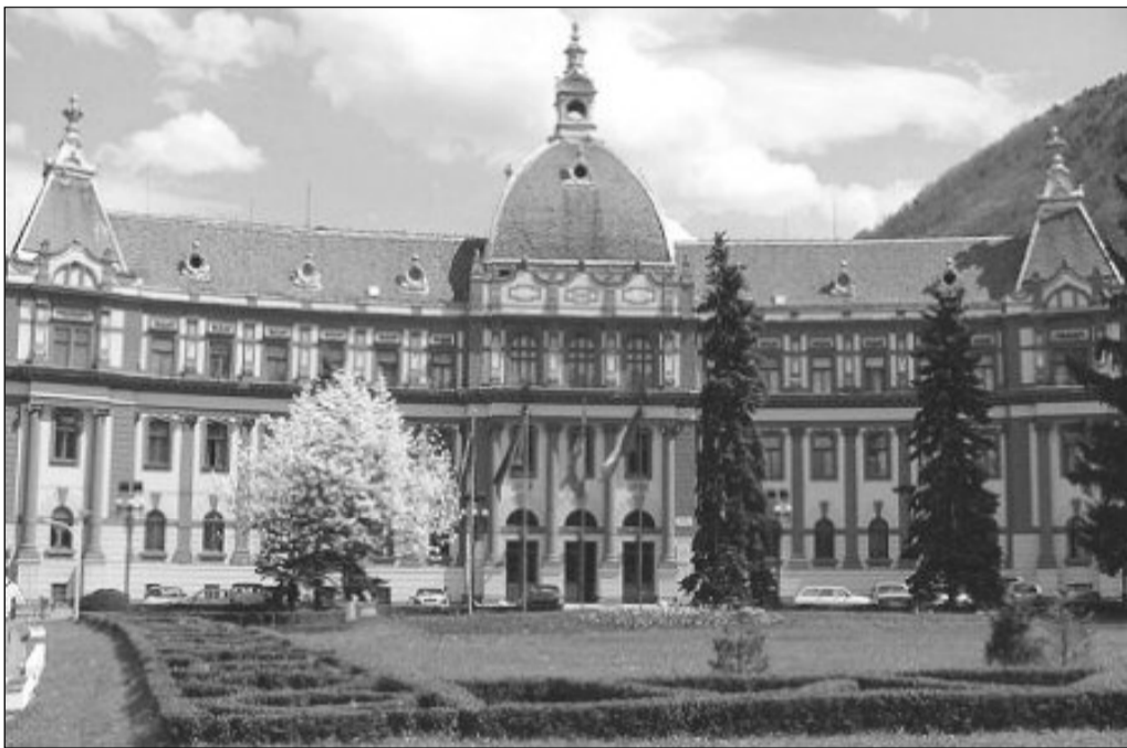
Clădirea unde își are sediul și Prefectura din județul Brașov

Anul acesta se împlinesc 150 de ani de la înființarea Instituției Prefectului în România, fapt certificat de Legea comunală din 1 aprilie 1864 și Legea pentru înființarea consiliilor județene, din 2 aprilie 1864, care prevedea că „prefectul, cap al administrației județene, dirige toate lucrările acestei administrații, îi execută hotărârile consiliului județean”.