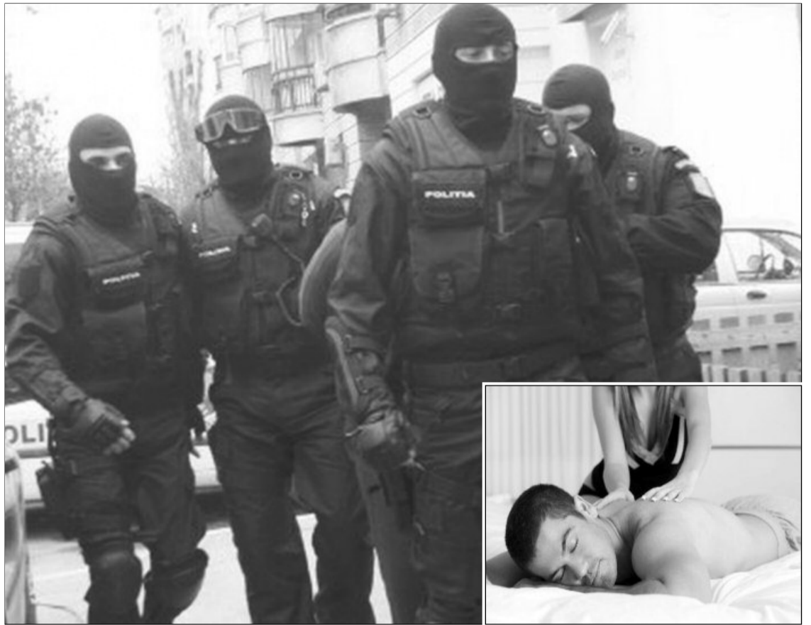
Ofițerii Brigăzii de Combatere a Criminalității Organizate au descins la 3 saloane de masaj erotic