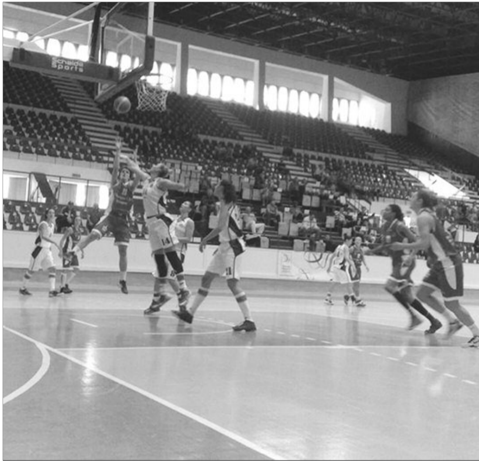
„Olimpicele”, s-au autodepășit în acest sezon!

Pauză pînă la toamnă! Pentru „olimpice” urmează o pauză foarte lungă, startul viitorului sezon fiind programat pentru jumătatea lunii septembrie! Oficialii formației de sub Tâmpa se gândesc însă de pe