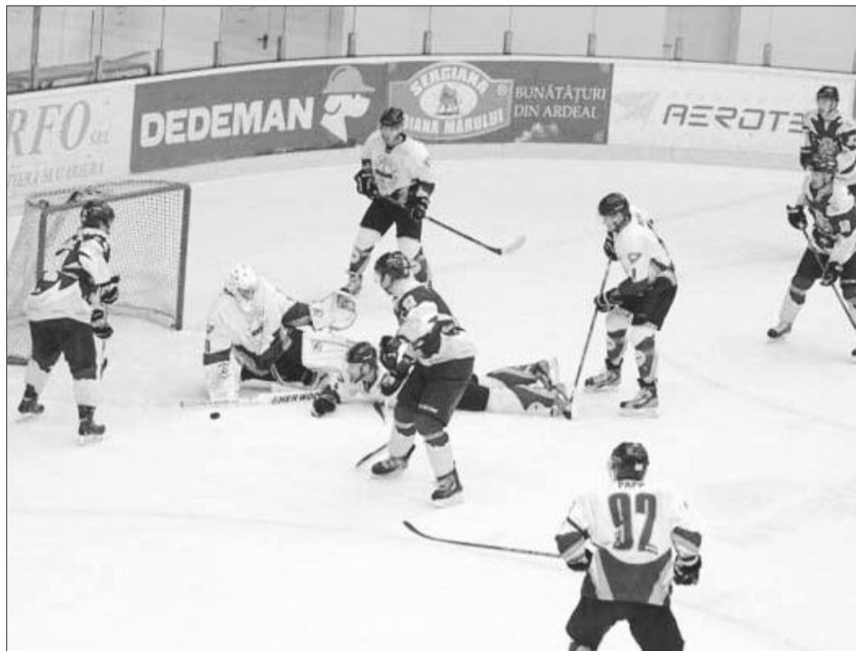
„Lupii” nu cedează în lupta pentru titlul național!