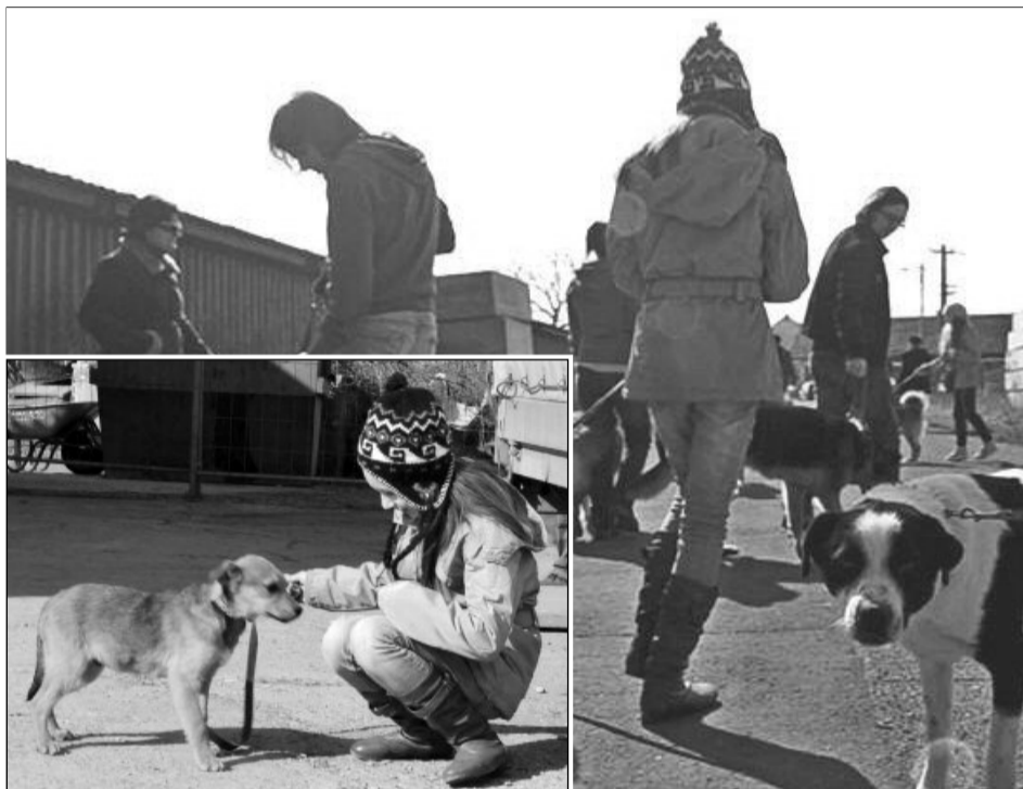
Copiii învață să îngrijească și să iubească animalele

„A fost un program de voluntariat început în urmă cu o lună. În fiecare sâmbătă am venit cu elevi din școlile generale din Brașov, din clasele a cincea și a șasea,