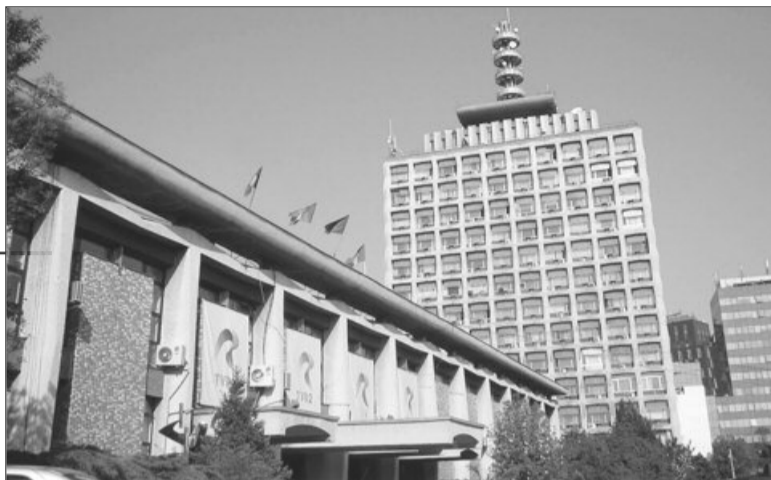
Televiziunea Română se confruntă cu mari probleme financiare