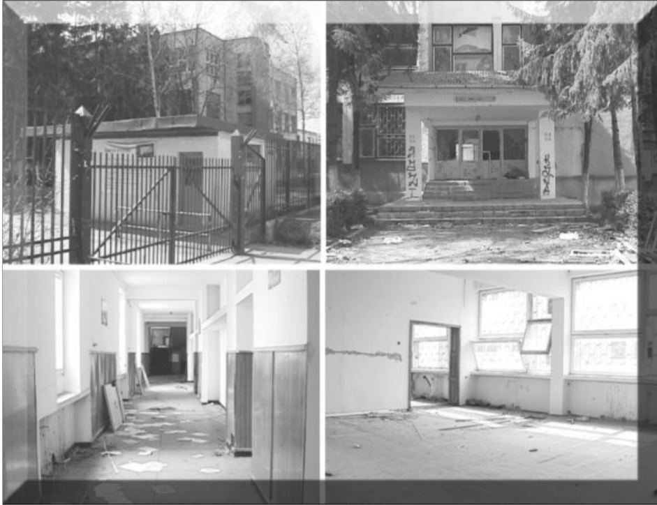
Așa arată acum clădirea în care a funcționat Grupul Școlar de Turism și Alimentație Publică

Clădirea în care a funcționat Grupul Școlar de Turism și Alimentație Publică este în paragină. Înainte să fie evacuată, locația a primit