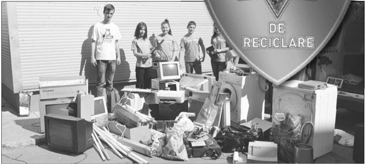
Firmele, instituțiile și cetățenii au șansa să contribuie la succesul copiilor brașoveni

firmele și instituțiile pot deveni Suporterii ai Patrulei de Reciclare, predând spre reciclare electrice nefolositoare: aparatele mici, bateriile, becurile și neoa-