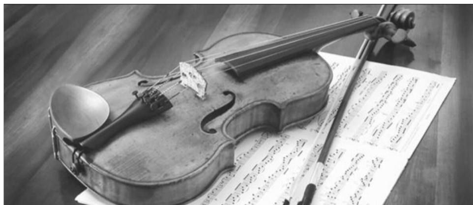
Viorile Stradivarius nu mai sunt considerate cele mai performante din lume

Fiecare solist a testat instrumentele într-o sală de concerte de 300 de locuri și într-una mai mare din Paris, au precizat cercetătorii, al cărui studiu a apărut în cea mai recentă ediție a Proceedings of the National Aca-