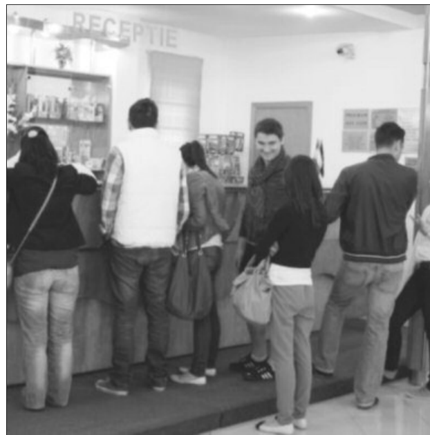
Afluxul de turiști din stațiuni va scădea dacă se adoptă taxa, spun hotelierii