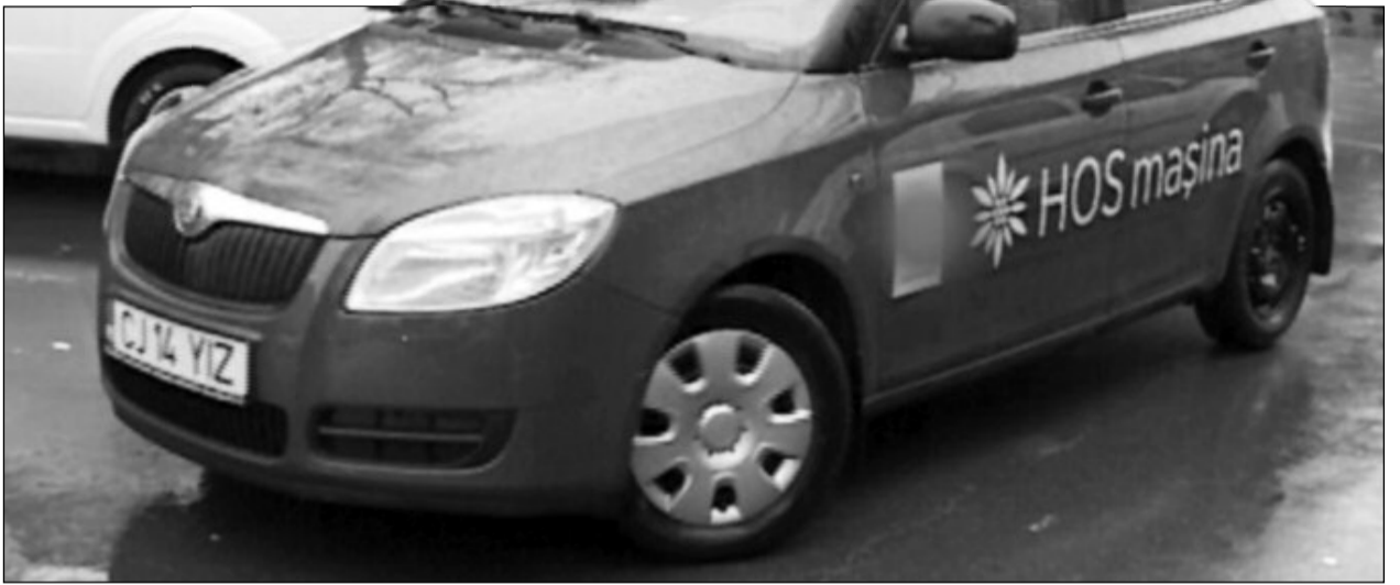
Pentru ca echipele medicale să poată ajunge la cât mai mulți pacienți, Hospice are nevoie de întinerească parcul auto

Pentru cei care poartă povara unui diagnostic nemilos,