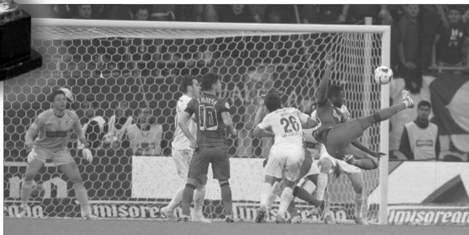
Steliștii sunt cu un picior în ultimul act al competiției!

Miza: un bilet pentru finala Cupei României!