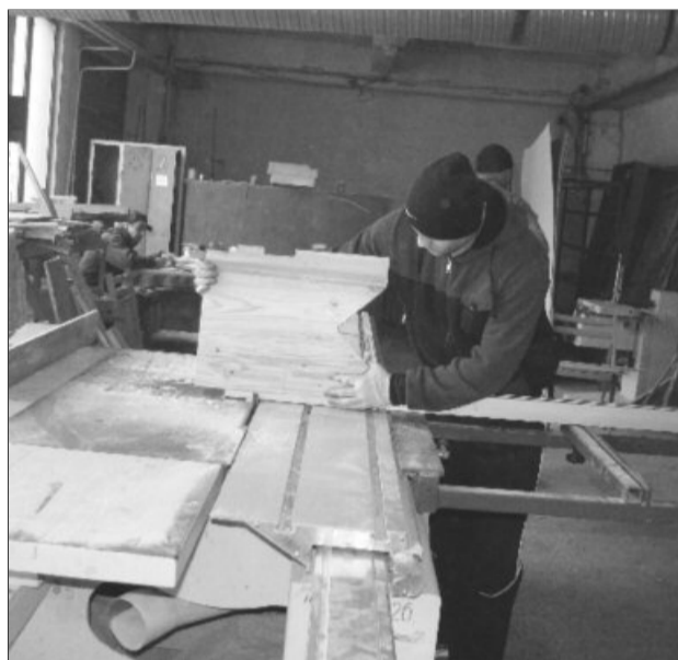
Bărbatul nu și-a irosit timpul după gratii, ci a învățat tâmplăria

în penitenciar, bărbatul a urmat un curs de calificare în meseria de tâmplar, iar ieri, la trei zile de la eliberare, s-a întors de bunăvoie în închisoare pentru a-și susține examenul de calificare, exa-