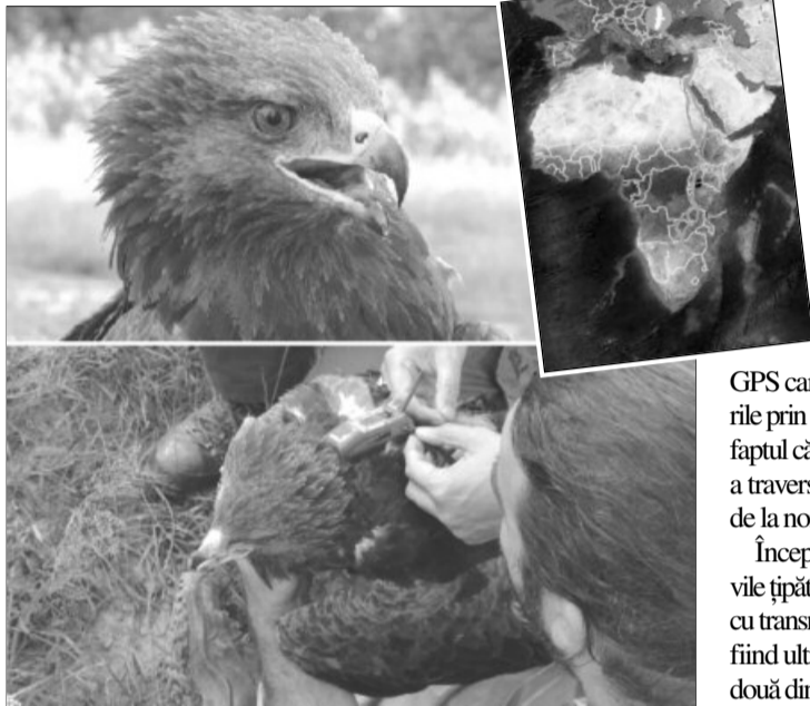
Arlie a parcurs o distanță de 25.000 de km pentru a ajunge în România

Drumul spre casă, sau migrația de primăvară cum spun specialiștii, a început exact de