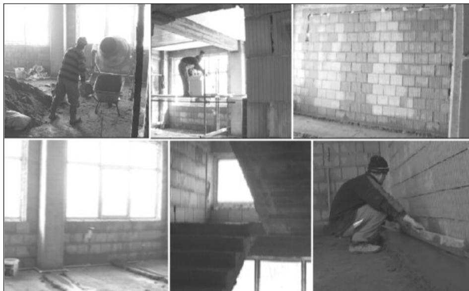
După Paște ar putea fi reluate lucrările la șantierul de pe Zizinului

Studiul de fezabilitate pentru această lucrare va fi realizată de RIAL, care are la dispoziție pentru realizarea acestei documentații, suma de o sută de mii de lei. Studiul ar trebui să fie făcut până cel târziu la începutul lunii iunie, după care proiectul ar trebui să fie supus unei