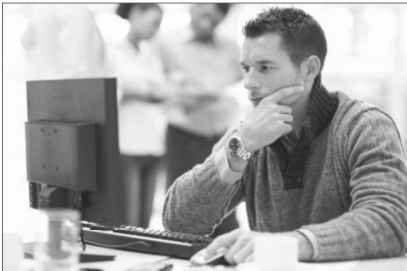
Comunicarea virtuală nu poate înlocui discuțiile față în față

Pentru că vorbitul în public nu se învață la școală, elevii și studenții trebuie să caute alte metode pentru a-și îmbunătăți aceas-