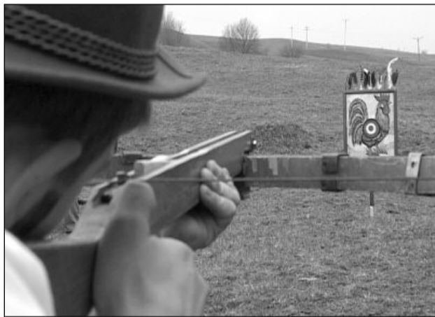
Cocoșul „trădător” este împușcat de Paște la Apața

Este vorba de un obicei tradițional, specific comunității din Apața. Se crede că originea obiceiului este legată de o legendă a locului din secolul al XIV-lea. În timpul unei invazii tătarăști, populația s-a retras în cetate. Invadatorii au pustiit localitatea, dar la retragere au auzit un cântat de cocoș în cetate, locuitori refugiați fiind astfel descoperiți. Cetatea a fost asediată, iar supraviețuitorii au hotărât drept pedeapsă împușcarea cocoșului care i-a trădat. Astăzi, participanții la