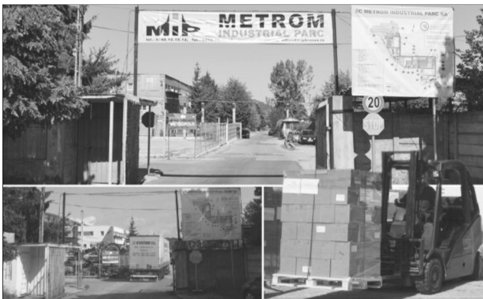
Parcurile industriale reprezintă un "motor" de dezvoltare economică

Șanse mari de dezvoltare pentru Brașov. Prezent la întrunirea amintită, unul dintre vicepreședinții APITSIAR și membru al Colegiului Director al asociației, directorul general al Parcului Industrial