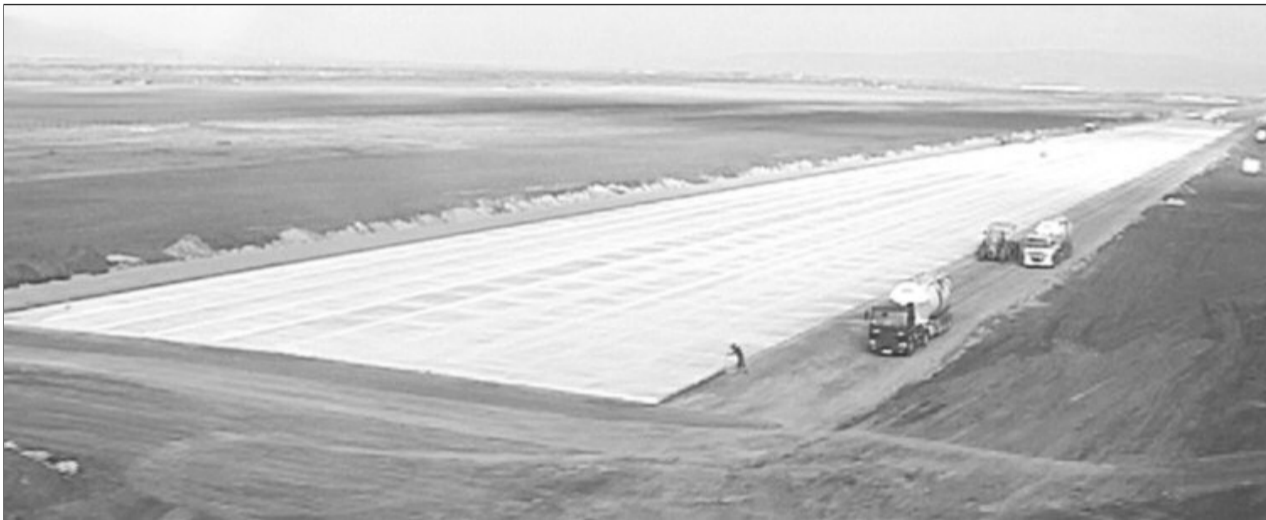
La momentul actual pista poate fi folosită de către avioanele ușoare pentru decolare și aterizare

Anunțul a fost făcut de președintele Consiliului Județean Aristotel Căncescu, după discuția pe care a avut-o cu brașoveanul care proiectează aeronave în Germania.