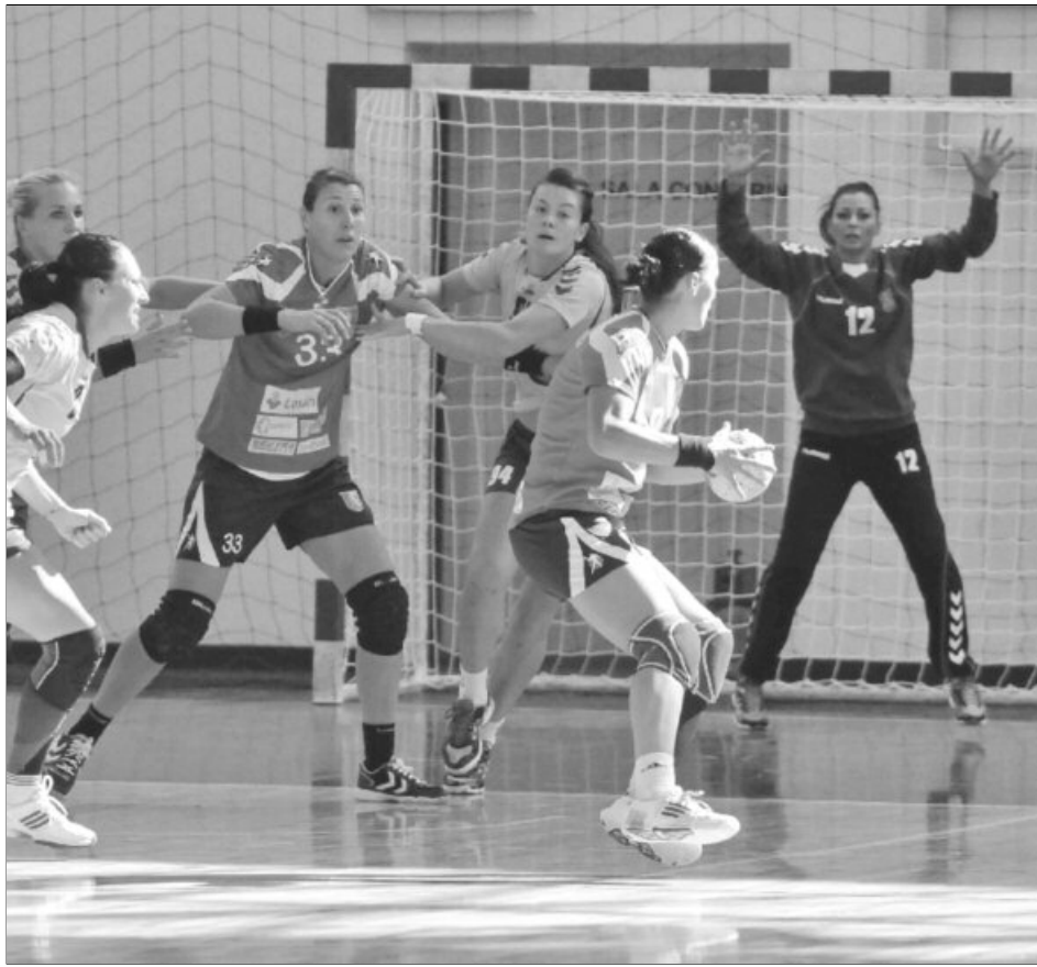
Handbalistele de la Corona Brașov nu au reușit să intre în finala mare a Cupei României, dar au reușit să câștige finala mică