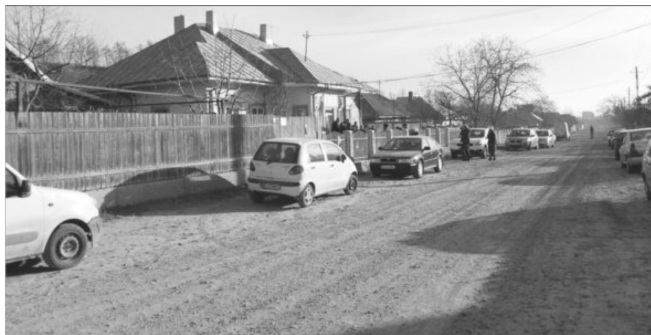
40% din drumurile publice din România arată ca în Evul Mediu

Potrivit sursei citate, peste 93% din drumurile naționale (15.956 de kilometri) erau modernizate, în timp ce drumurile județene erau modernizate în proporție de 29% (10.304 km), iar cele comunale, de 9% (2.893 km).