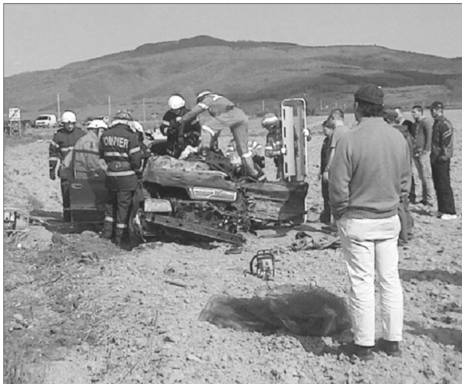
Una dintre mașinile implicate în accident a fost proiectată în afara carosabilului

Toți răniții au fost transportați ulterior la Spitalul Ju-