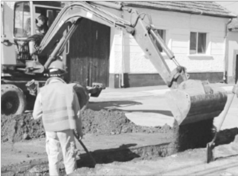
Compania Apa implementează cel mai amplu proiect de investiții din istoria județului nostru

Proiectul „Reabilitarea și extinderea sistemelor de apă și canalizare în județul Brașov” implementat de SC Compania Apa SA în calitate de operator regional în domeniul furnizării serviciilor de apă și canalizare cuprinde 14 tipuri de lucrări, două dintre acestea încheiate, restul aflate în diverse stadii de execuție.