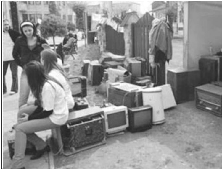
Elevii vor învăța să protejeze mediul prin colectarea deșeurilor electrice

"Noi în afara concursului o să organizăm un