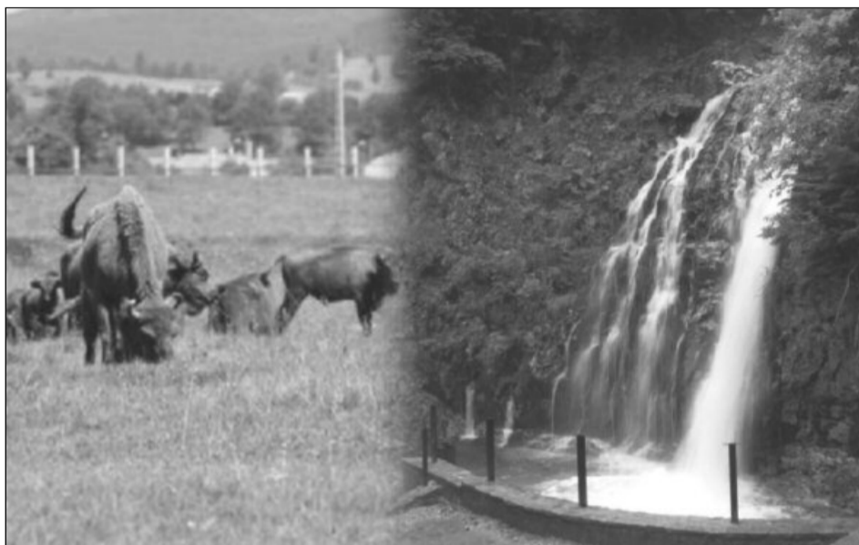
O oază de liniște și de relaxare în județul Brașov

Primele cinci exemplare au fost aduse din Austria și Elveția, câte două, și unul din Italia. Băncile, foșoarele și leagănele amplasate la umbră oferă turiștilor condiții foarte bune