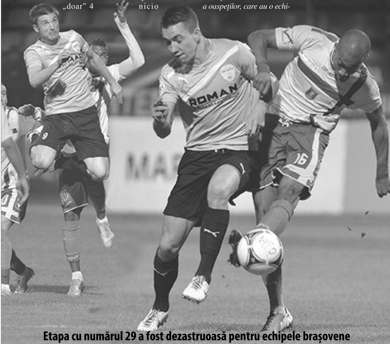
Etapa cu numărul 29 a fost dezastruoasă pentru echipele brașovene