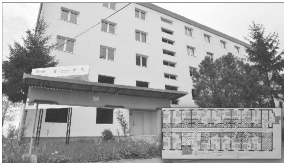
Blocul de locuințe sociale ar trebui să fie gata până la sfârșitul acestui an

Municipalitatea a fost nevoită să organizeze o nouă licitație pentru desemnarea unui nou constructor deoarece cel dinaintea nu avea capacitatea de a realiza aceste lucrări. Clădirea va fi reabilitată cu destinația locuințe sociale pentru un număr de 44 de fa-