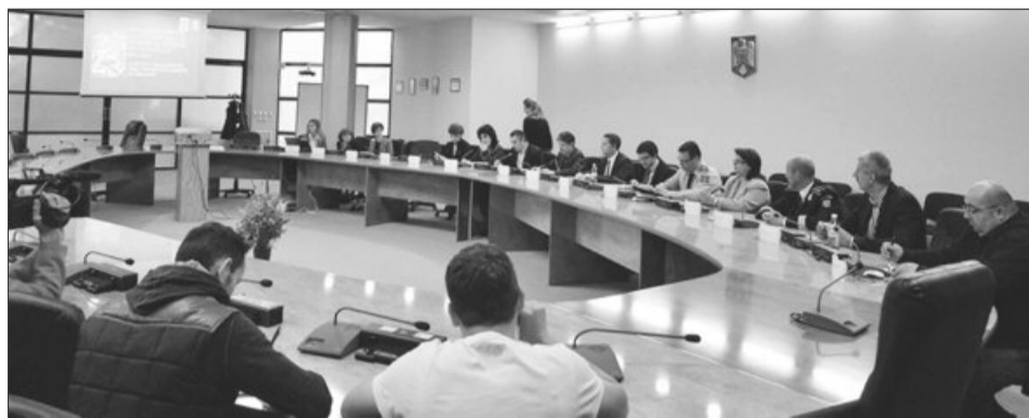
Specialiști de la Forumul European de Securitate Urbană oferă soluții ca și Brașovul să devină un oraș turistic sigur

Proiectul facilitează schimbul de experiență între orașe din Italia, Franța, Spania, Germania și Polonia totul pentru a îmbunătăți siguranța turiștilor și a cetățenilor. Proiectul, care va dura până în 2015, conține 6 studii, iar primul a