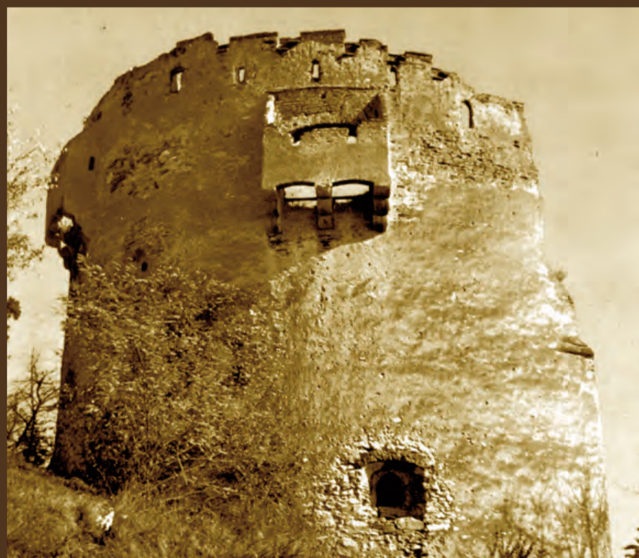
136. Weisser Turm (Talseite) und Graftbastei (links).