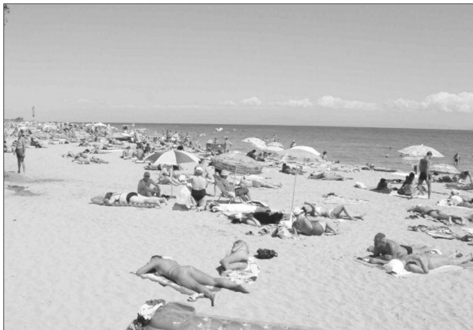
Plătești șase zile de cazare și stai șapte, prin programul „Zile gratuite de vacanță pe Litoralul românesc”

Pachetele pornesc de la 518 lei/persoană, cu mic dejun, pentru șase nopți de cazare și una gratuită, la un hotel de două stele din stațiunea Venus, de la 822 de lei/persoană, cu mic dejun, pentru cinci nopți de cazare și una gratuită, la un hotel de trei stele din Eforie Nord și de la 975 de lei/persoană, cu mic dejun, pentru șase nopți de cazare și una gratuită, la un hotel de patru stele din stațiunea Mamaia.