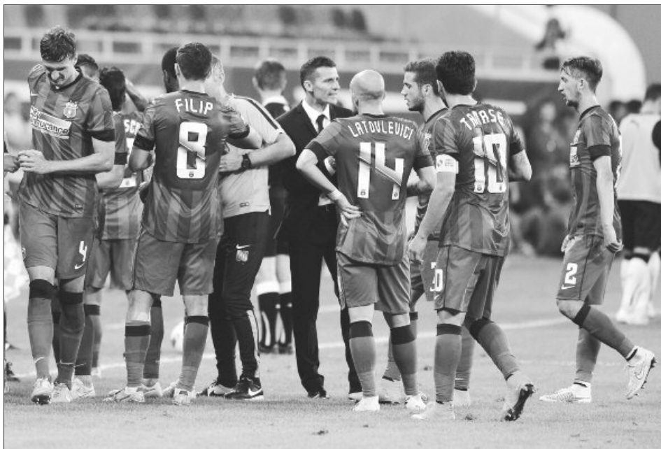
Steliștii au făcut o repetiție bună pentru returnul cu Aktobe