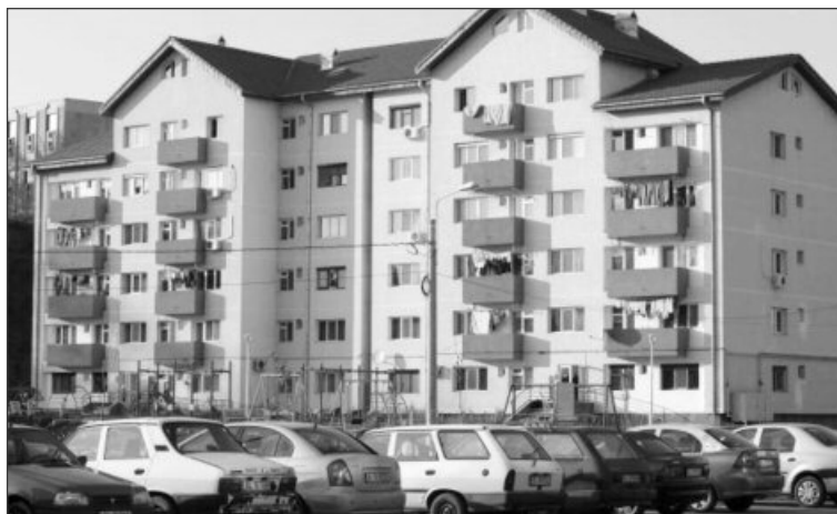
Guvernul a stabilit numărul maxim de ani pe care se pot "întinde" ratele la locuințele ANL

maxim 15 ani, în cazul în care, la data vânzării, venitul mediu pe membru de familie al titularului contractului de închiriere a locuinței depășește cu 80% — 100% salariul mediu brut pe economie, în maxim 20 ani, în cazul în care același venit depășește cu 50% — 80% salariul mediu brut pe economie și în maxim 25 ani în cazul în care, la data vânzării, venitul mediu pe mem-