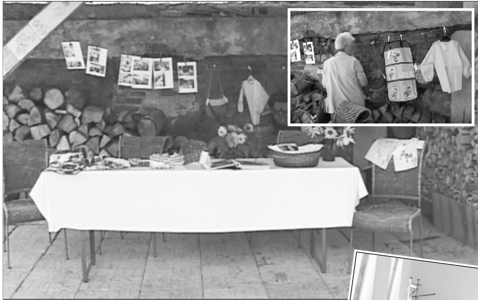
Persoanele defavorizate fac produse hand-made care sunt foarte căutate

„Noi, la Fundația pentru Copii Abandonați, am crescut copii de la vârsta de 2-3 ani care sunt acum adulți și deoarece aceștia au întâmpinat dificultăți în menținerea unui job