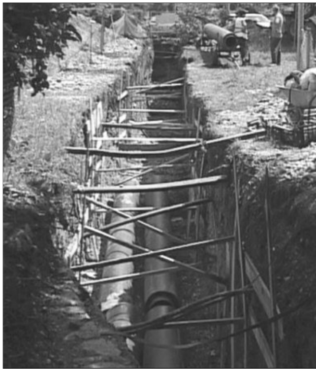
Lucrări de modernizare în toi la sistemul centralizat de încălzire

Consiliul Local Brașov a aprobat joia trecută o investiție de 16,7 milioane lei inclusiv TVA (aproximativ 3,8 milioane euro) pentru lucrări de racordare la sistemul centralizat a 39 de instituții din Brașov, a patru blocuri și a unui ansamblu de locuințe, la care se adaugă lucrări pentru eficientizarea consumului de energie termică la alte 28 de instituții de învățământ și la Căminul pentru persoane fără adăpost. Printre noii clienți ai Tetkron ar urma să se afle mai multe instituții de învățământ, Aula amfiteatru a