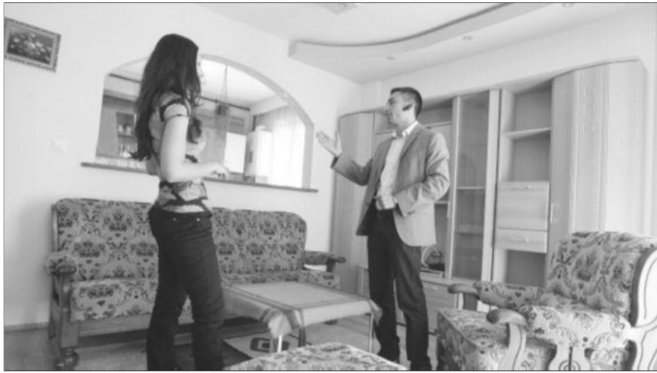
Un număr mic de locuințe din Brașov au fost asigurate obligatoriu, potrivit statisticilor

Potrivit purtătorului de cuvânt al Primăriei, Sorin Toarcea, mu-