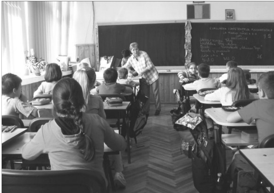
Cursurile școlare încep pe 15 septembrie

Totodată, pentru clasa a VIII-a, anul școlar are 36 de săptămâni, din care durata cursurilor este de 35 de săptămâni, o săptămână fiind dedicată desfășurării evaluării