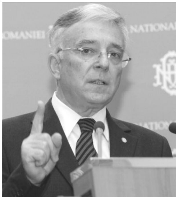
Guvernatorul BNR trage un semnal de alarmă

Guvernatorul a reamintit că băncile au trecut printr-un proces dureros de ajustare, atunci când băncile mamă au