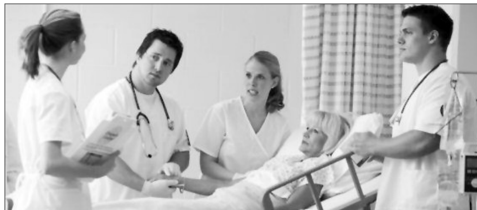
Britanicii caută asistenți medicali pentru îngrijirea persoanelor vârstnice

diplome și recomandări pe adresa de e-mail: hochdorfer@HKS-Gruppe.de .