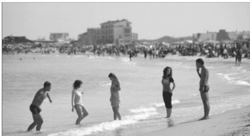
Litoralul este o variantă de a petrece zilele libere cu prilejul minivacanței de Sfânta Maria

În ceea ce privește stațiunile montane, mai ales cele din zona Bran - Moeciu, și cele