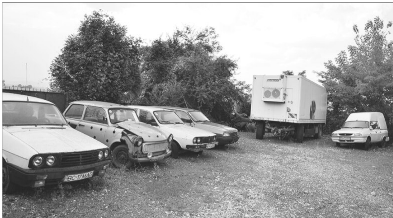
Ridicarea mașinilor abandonate se face fie la sesizarea cetățenilor, fie a Poliției locale sau a inspectorilor primăriei

Ridicarea mașinilor abandonate se face fie la sesizarea cetățenilor, fie a Poliției locale sau a inspectorilor primăriei. În cazul în care municipalitatea este sesizată cu privire la existența unor astfel de vehicule, un inspector al Primăriei se deplasează la fața locului și constată starea în care sa află vehiculul. Dacă proprietarul este cunoscut, acesta este notificat cu confirmare de primire, și are la dispoziție cinci zile de la primirea notificării pentru a-și ridica mașina din acel loc. În cazul vehiculelor pentru care nu pot fi identificați proprietarii, notificarea este atașată de parbrizul mașinii, inspectorul primăriei face poze cu mașina și notificarea pentru a putea dovedi că a anunțat proprietarul, iar acesta din urmă are zece zile la dispoziție pentru a-și revendica mașina. În cazul în care în termenul prevăzut, proprietarul nu și-a mutat vehiculul din locul respectiv, rabla este ridicată cu ajutorul firmei AN&AG SRL, care