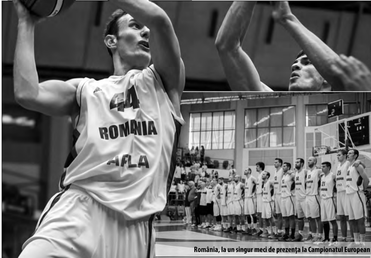
România, la un singur meci de prezență la Campionatul European

Tricolorii, la un meci distanță de Europene