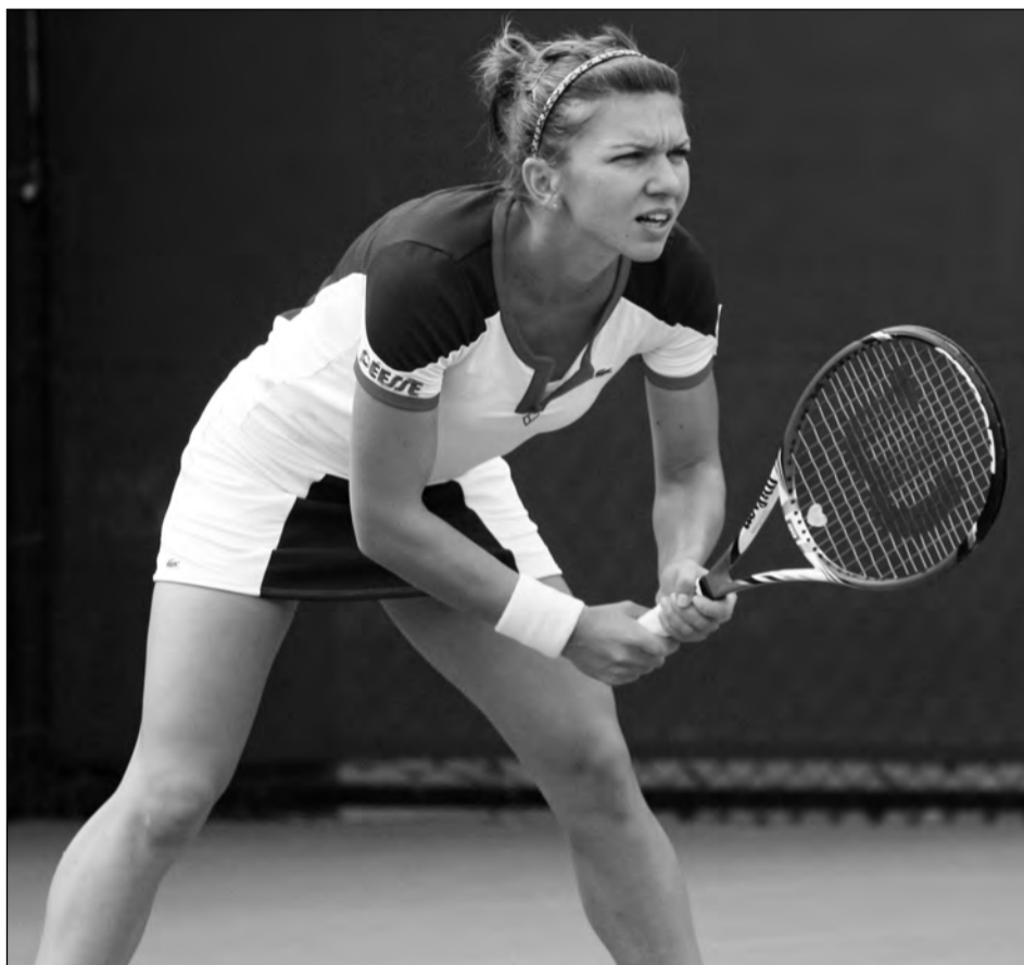
Halep s-a întrebunțat serios pentru a ajunge în turul 2 la US Open!

„Am învățat că trebuie să lupt pînă la capăt!” Halep a declarat că în meciul cu Danielle Rose Collins a avut emoții, însă a învățat că trebuie să lupte pînă la ultima minge și să câștige partida chiar dacă a pierdut primul set. „A fost un meci dificil, am început un pic nervoasă, cu emoțiile care sunt mereu în primul tur la un turneu, ea a jucat foarte bine, este tânără, motivată, vine de la colegiu și n-a avut nimic de pierdut. Am încercat să fac tot ce pot pe teren și de aceea probabil l-am și câștigat. Am învățat că trebuie să lupt pînă la ultima minge și să am încredere că pot câștiga meciul chiar dacă am pierdut primul set”, a declarat Halep, care a spus că nici nu știa cum arată adversara ei, deoarece a văzut-o prima oară pe teren. Danielle Rose Collins a afirmat că meciul cu Simona Ha-