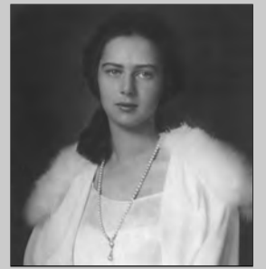
(Ileana főhercegnő Brassóban. În: Brassói Lapok, nr. 187, 17 august 1939)