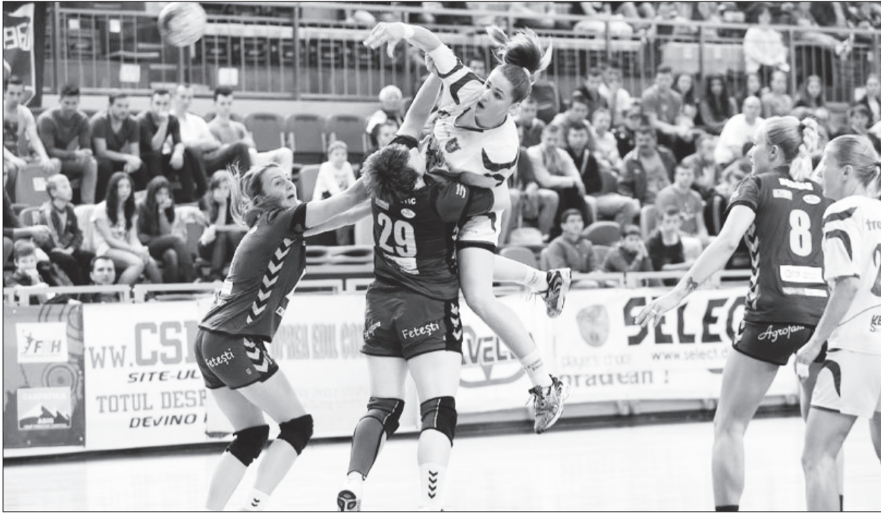
Viccampioanele României sunt pregătite de un nou sezon!

Corona Brașov are ambiții mari și în acest campionat!