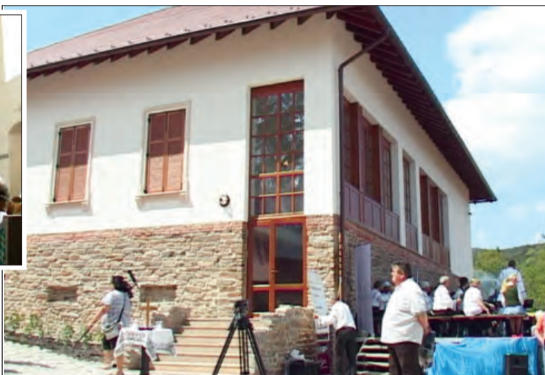
Fosta casă parohială din Criț va asigura condiții de cazare premium în această zonă