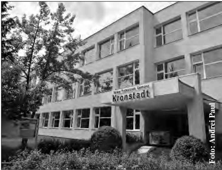
Elevii de la Școala Profesională Germană "Kronstadt" au locurile de muncă asigurate

Municipalitatea a publicat ieri pe site-ul SEAP (Serviciul Electronic de Achiziții Publice) anunțul de licitație pentru lucrarea de reamenajare a imobilului în care se vor afla atelierelor Școlii Profesionale Germane „Kronstadt” (SPGK).