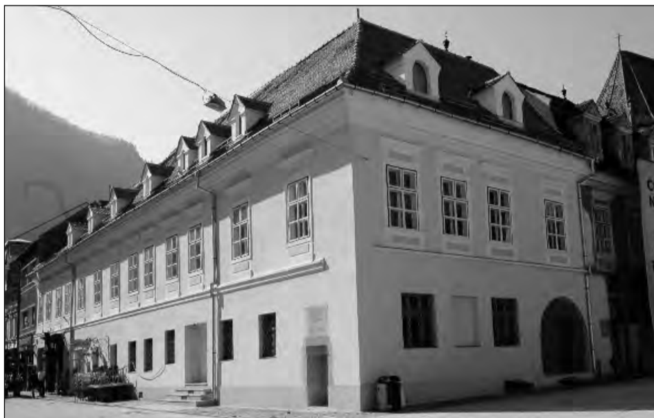
Muzeul Civilizației Urbane a Brașovului

„Gravurile Veronicăi Bodea Tatulea, în calitate de repere semnificative ale unui destin creativ, amplu desfășurat și sensibil nuanțat, aflat într-o împlinire definitivă în ultimul deceniu, sunt compuse din multiple straturi iconografice, corespunzând unei memorii culturale, mereu prezentă în fi-