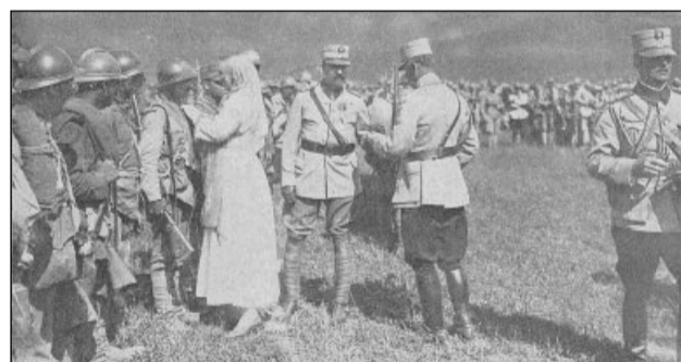
Regele Ferdinand și Regina Maria decorând militari care au luptat la Mărășești, august 1917

Agitatorii din Partidul zis Național au și intrat în acțiune, începând să clevească marele act al Încoronării pe care românimea îl așteaptă cu nerăbdare de multă vreme și