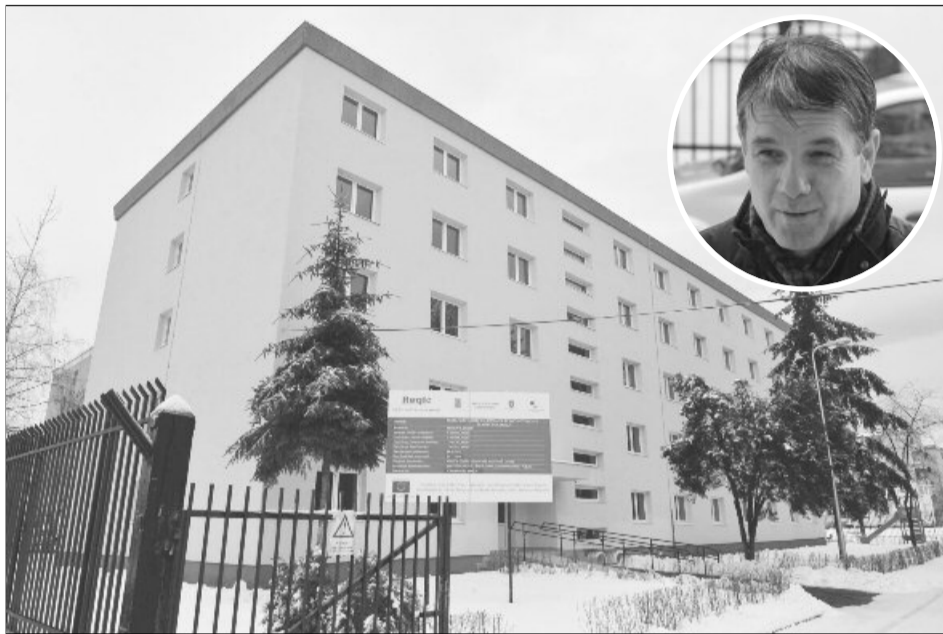
Blocul de locuințe sociale a fost amenajat cu fonduri europene, potrivit primarului George Scripcaru

„Mă bucur că am reușit să ne înținem de cuvânt și să le oferim celor 44 de familii cel mai frumos