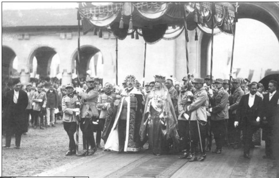
Încoronarea de la Alba Iulia

E cea mai mare serbătoare a neamului românesc, fiindcă în ea, ca într-o sintetică și supremă apoteoză, se întrupează în mod viu realizarea idealului nostru național, pentru care a curs, în timp de veacuri nu numai cerneala sfântă a marilor noștri scriitori, ci valuri generoase de sânge, care au cimentat deapauri mândrul edificiu al României-Mari.