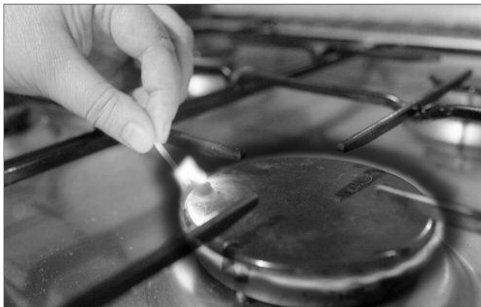
Gazele naturale produse în România, și plătite de populație, nu se vor scumpi până la data de 1 iulie 2015

Ministrul delegat pentru Energie, Răzvan Nicolescu, a avut marți, la București, o întâlnire cu reprezentanții Fondului Monetar Internațional (FMI), ai Comisiei Europene (CE) și ai Băncii Mondiale. Discuțiile au vizat continua-