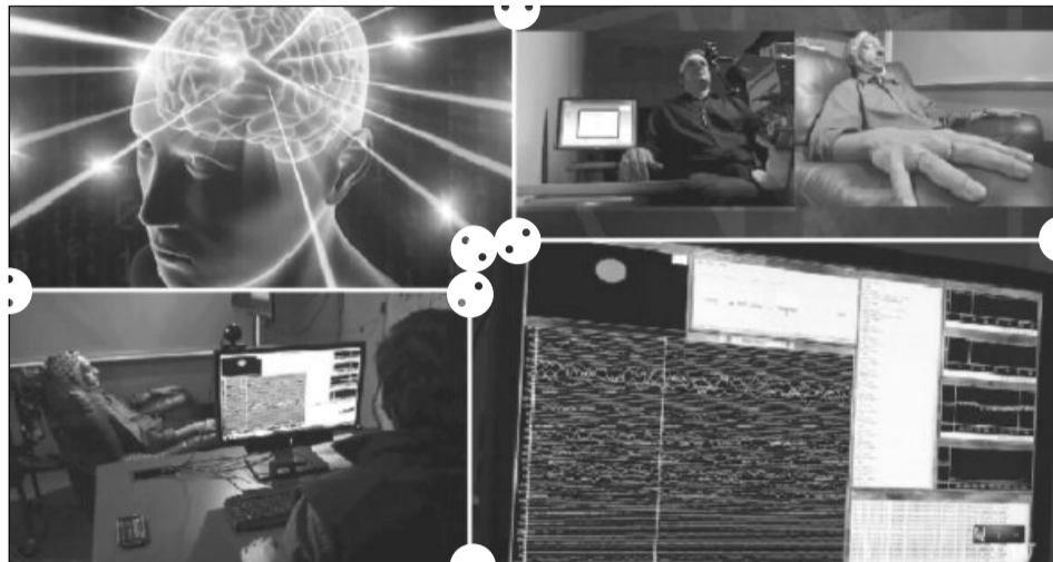
Imagini din timpul experimentului care demonstrează că telepatia este posibilă

Într-un studiu efectuat pe șase voluntari, cercetătorii au arătat că prin folosirea unei interfețe de tip creier-creier se pot obține rezultate care până acum țineau de domeniul SF. Savanții au făcut teste pe trei perechi de oameni și au avut o rată de succes cuprinsă între 25 și 83 la sută. Rezultatele sunt foarte bune, având în vedere că tehnologia