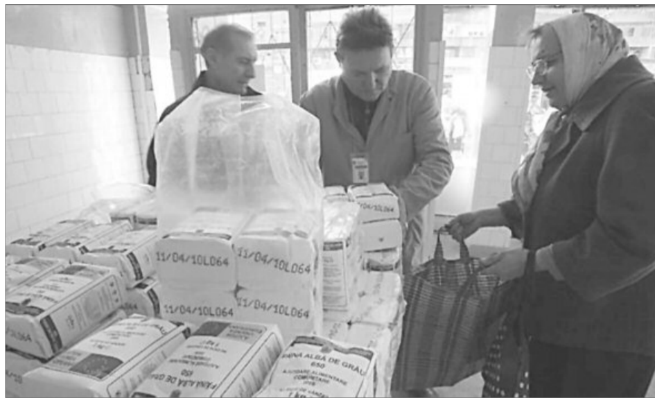
Brașovenii care sunt în situații dificile vor primi produsele alimentare oferite de Uniunea Europeană

„Primăriile vor primi în cursul acestei săptămâni listele nominale cu persoanele îndreptățite să primească cupoane și implicit ajutoarele alimentare. Pentru persoanele care dețin cupon, pachetele cu