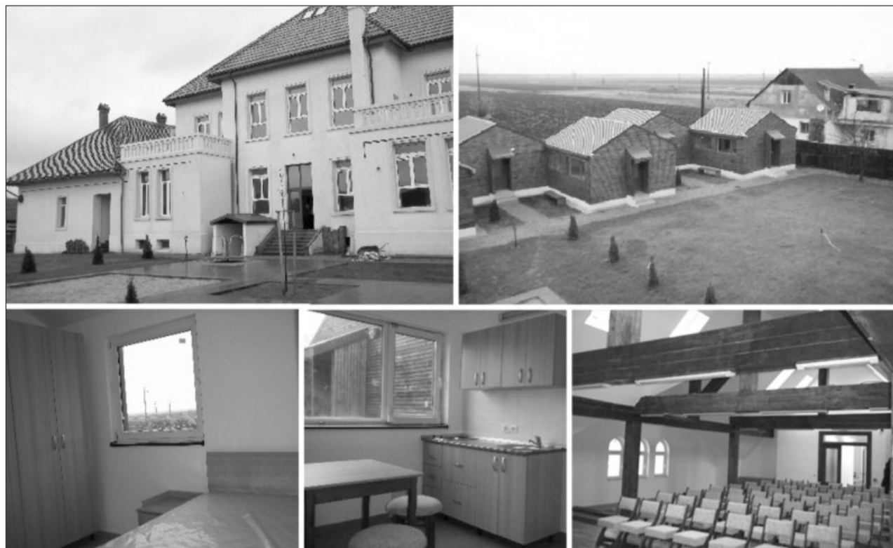
Centru social din Hălchiu va oferi un sprijin pensionarilor aflați în dificultate

Locuințe sociale și o sală multifuncțională pentru seniorii din Hălchiu! Este vorba despre un proiect care a avut ca finalizare reabilitarea și modernizarea clădirii unde funcționează Centrul social al comunei brașovene.