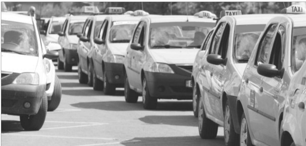
Tarifele mai mari au fost cerute și obținute de șoferii de la toate dispeceratele taxi din Brașov

În cazul asociațiilor familiale și persoanelor fizice autorizate (unde fiecare AF sau PFA are o singură mașină), au fost depuse 283 de solicitări de majorare a tarifelor, dintr-un total de 410 mașini înregistrate, și au fost deja eliberate 223. „Conform prevederilor legale, Municipality avizează tarifele cu care circulă taximetriștii autorizați în Brașov, în limita prețului maximal aprobat de Consiliul Local Brașov, preț maximal care este de 2,2 lei/kilometru. În ultima perioadă, am primit din ce în ce mai multe solicitări de majorare și/sau de introducerea tarifelor diferențiate, de zi și de noapte, de la toate dispeceratele existente în Brașov. Cererile vin atât din partea societăților comerciale, cât și din partea persoanelor fizice autorizate sau