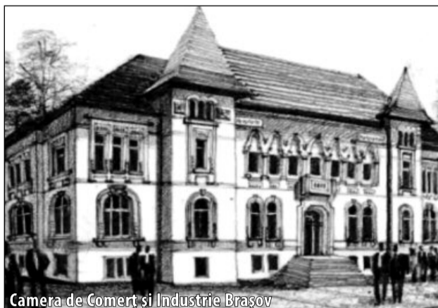
Camera de Comerț și Industrie Brașov

Duminică, la ora 10, a început Congresul Național al Pensionarilor în sala festivă a Camerei de Comerț și Industrie Brașov. Au participat reprezentanții filialelor locale ale Uniunii Pensionarilor, conducerea centrală din București, membrii brașoveni și președintele Uniunii Angajaților la Stat.