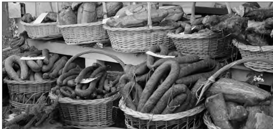
Noua legislație îi va împiedica pe comercianți să falsifice produsele tradiționale

„E o diferență foarte mare. Anul trecut aveam 4.500 de produse atestate ca fiind tradiționale, iar anul acesta avem 298, după ce am schimbat regulile. De ce mai puțin? Pentru că am pus anumite condiții care au li-