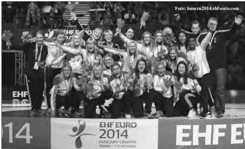
Norvegia a câștigat pentru a 6-a oară titlul de campioană europeană la handbal feminin!

Neagu a doua marcatoare a turneului. Suedeza Isabelle Gullden, a fost cea mai bună marcatoare a Europeanului găzduit de Un-