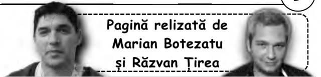
Pagină relizată de Marian Botezatu și Răzvan Tîrea

dificil, dar a fost o finală și era normal să fie așa. S-au întâlnit două echipe foarte bune. Ei au fost mai buni în prima repriză, în care noi nu am jucat mai nimic, apoi a doua repriză a fost controlată de noi, iar în repriza a treia am fost un pic mai buni decât ei. Mă bucur pentru această victorie și îi felicit pe băieții pentru că au reușit să reintre în meci și să întoarcă rezultatul. Publicul a fost de nota 10”, a spus și tehnicianul formației brașovene Jerry Andersson. Brașovenii vor juca astăzi în Liga Mol împotriva celor de la Sport Club Miercurea Ciuc, în deplasare.