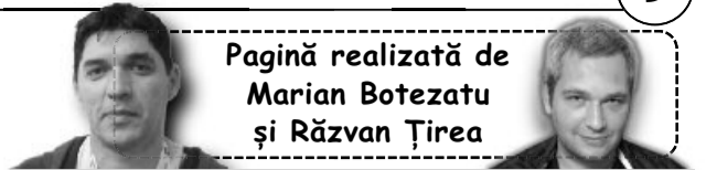
Pagină realizată de Marian Botezatu și Răzvan Țirea

turul doi și mi-am oferit a doua șansă în acest turneu. Nu a fost suficient astăzi, dar îmi place mult aici”, a spus Șarapova.