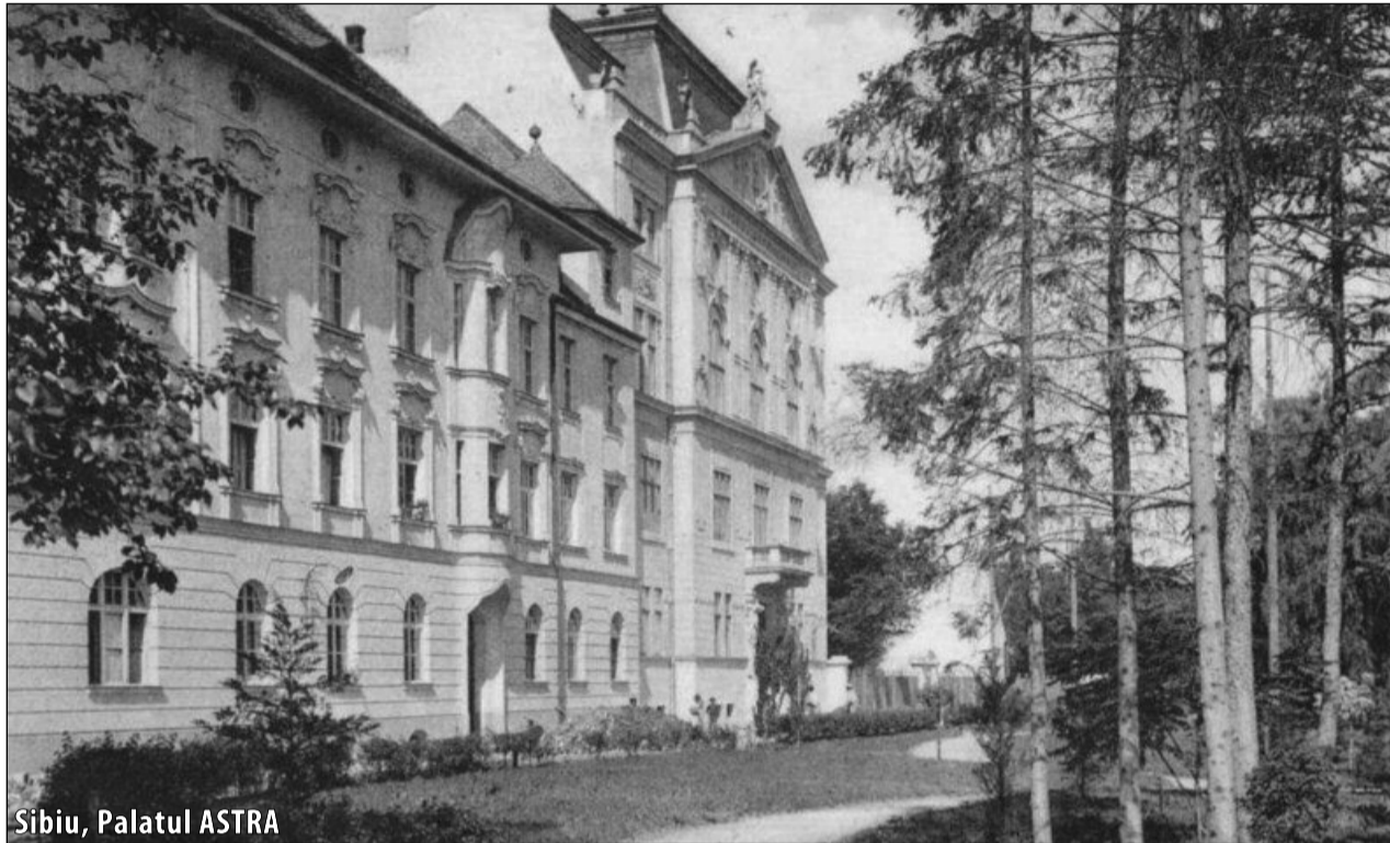
Sibiu, Palatul ASTRA

În afară de acestea tot de loterie atârână și lărgirea actualelor case ale Asociațiunii din Sibiu, care sunt absolut