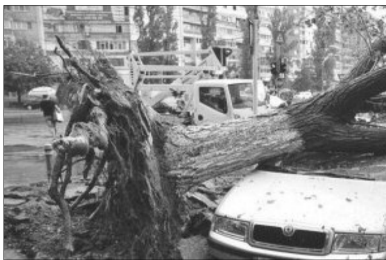
Vântul puternic a făcut prăpăd vineri noapte la Brașov