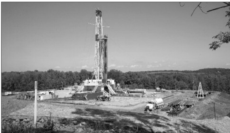
Exploatarea gazelor de șist începe să nu mai fie profitabilă

Boom-ul gazelor de șist în Statele Unite ale Americii a revitalizat industria energetică a americanilor, care speră să atingă independența energetică până în 2020, țel considerat exagerat de ambițios de unii