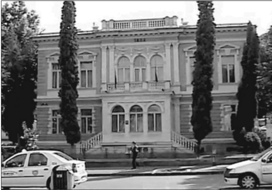
Mansarda Casei Baiulescu din Livada Poștei va fi gazda evenimentelor organizate de Biblioteca Județeană

Muzeul Civilizației Urbane – Lansarea revistei ASTRA istorie și a cărții supliment . Prezintă: directorul Bibliotecii