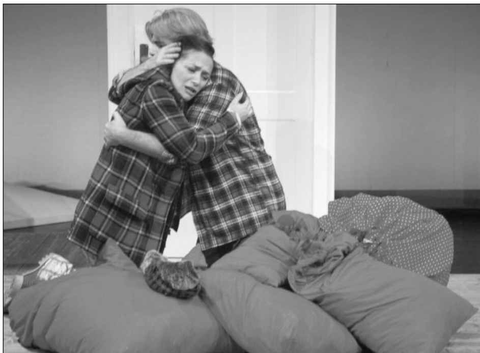
„Cu inima în pungă” pe scena teatrului „Sică Alexandrescu”

Prețul biletelor: categoria I – 11 lei; categoria II – 9 lei; Preț redus pentru elevi, studenți, pensionari: 5 lei