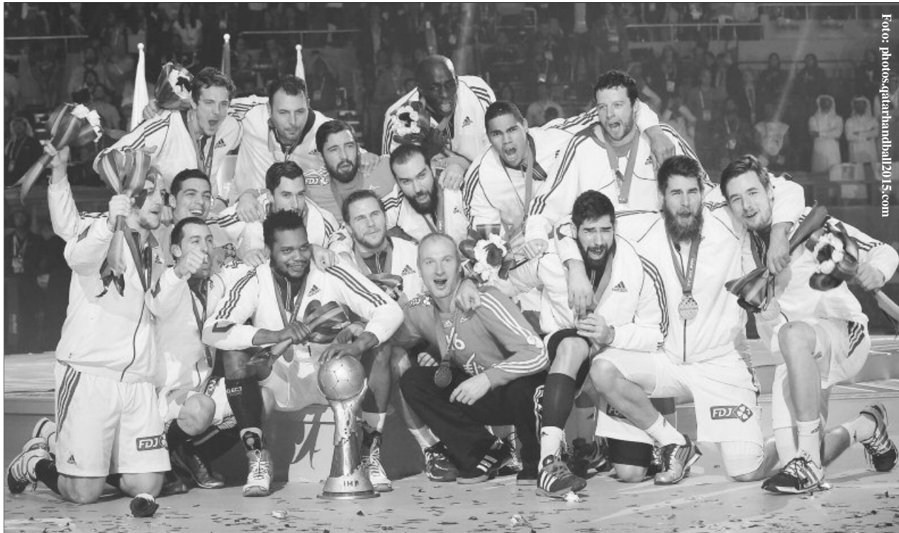
Franța scrie istorie pe semicerc: campioană mondială pentru a cincea oară!

Franța este noua campioană mondială la handbal masculin