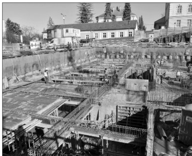
Cea mai modernă parcare din Brașov prinde contur

Până acum au fost turnați cei 18 piloni centrali și ceri 110 perimetrali, care vor sprijini întreaga structură, a fost construită grinda de coronament și a fost turnat radierul (un fel de fundație a clădirii, care se află între nivelul -12 și -13 metri) și s-a montat tubulatura structurii de rezisten-