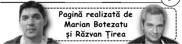
Pagină realizată de Marian Botezatu și Răzvan Țirea