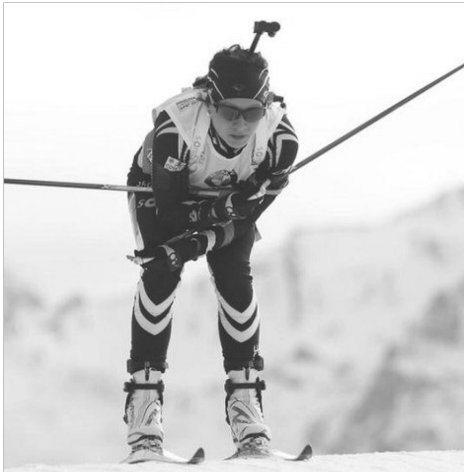
Performanța senzațională pentru biatlonul românesc, obținută de o brașoveancă!

„Sunt foarte mândră de această medalie!” Referindu-se la succesul de la Europenele din Estonia, sportiva română a povestit, într-un interviu acordat site-ului CS Dinamo, modul în care a decurs proba pe care a câștigat-o. „Până înainte de ultima tragere eram conștientă că pot face o cursă bună. Alergarea îmi mergea, aveam schiuri ceruite ca la carte, iar după ultima tragere s-a decis totul. Am ieșit din poligon pe locul 2, la o distanță foarte mică de primul loc. Pe ultima tură am dat totul și am reușit să câștig aurul european, de care sunt foarte mândră. Alături de mine l-am avut pe Gheorghe Stoian, care îmi este antrenor de lot, dar și de