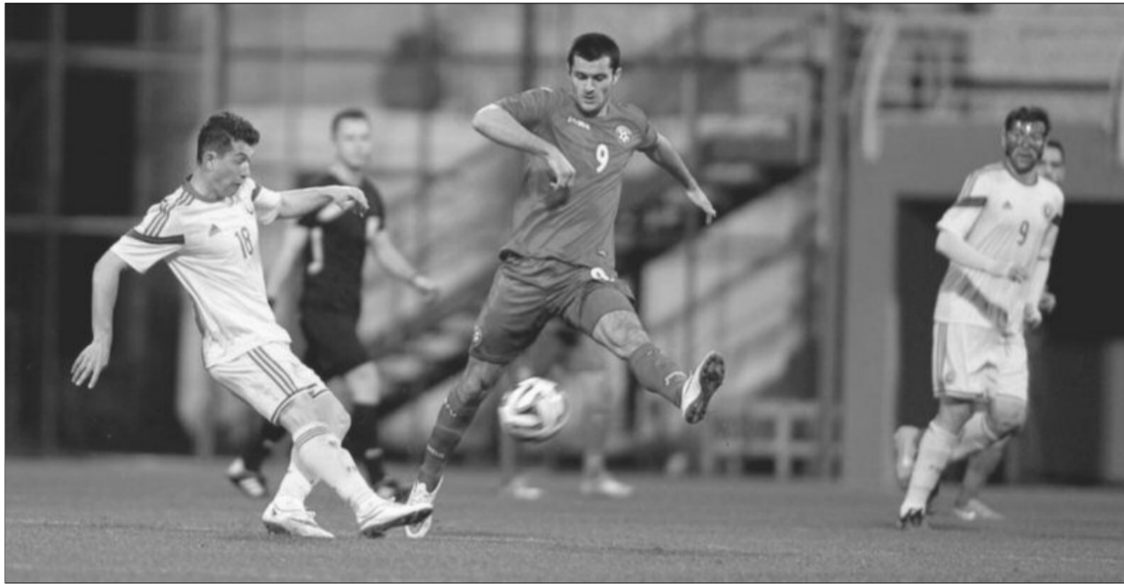
Echipele secundare ale României și Bulgariei au remizat fără gol, în Antalya

Echipele secundare ale României și Bulgariei au încheiat nedecis