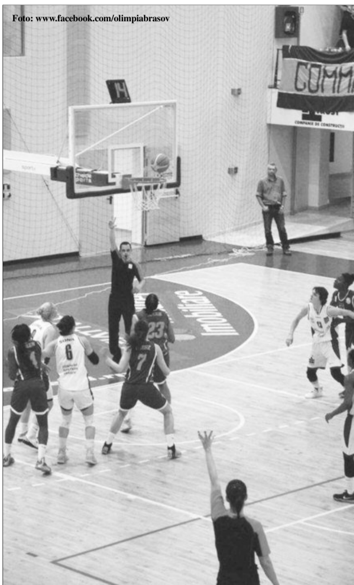
„Olimpicele” au fost foarte aproape de o mare surpriză, în jocul cu echipa campioană!