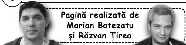
Pagină realizată de Marian Botezatu și Răzvan Țirea