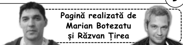
Pagină realizată de Marian Botezatu și Răzvan Țirea

pentru Baia Mare. Din păcate, trupa de sub Tâmpa a rămas în inferioritate numerică, iar campioanele României au putu gestiona mai ușor finalul de joc și s-au impus la final cu scorul de 25-21. Pentru Corona au marcat: Zamfir 6 goluri, Brădeanu 4, Hotea 3, Dincă, Rațiu și Chișer câte două goluri fiecare, Apetrei și Bondar câte o reușită.