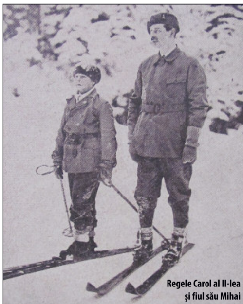
Regele Carol al II-lea și fiul său Mihai

Denumirea de Râșnov are la bază cuvântul „roz” care