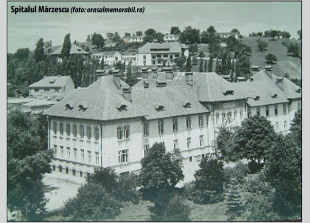
Spitalul Mârzescu

3500 de pacienți operați care s-au ridicat în picioare chiar în ziua operației. Metoda Câmpeanu prezentată într-o lucrare de diplomă (I)