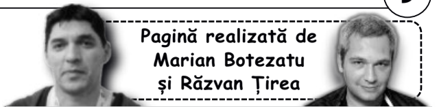
Pagină realizată de Marian Botezatu și Răzvan Țirea

Aseară s-au jucat ultimele meciuri. Aseară au fost programate alte două partide interesante din manșa tur a optimilor de finală ale Champions League. La Londra, Arsenal a primit vizita formației franceze AS Monaco. „Tunarii” porneau ca mari favoriți, însă francezii au demonstrat în acest sezon de Liga Campionilor că își pot ridica foarte mult nivelul jocului. În cealaltă partidă a seriei, în Germania, Bayer Leverkusen a primit vizita finalistei de anul trecut a Ligii, Atletico Madrid. Se anunța un duel extrem de interesant și de echilibrat. Partidele s-au terminat după închiderea ediției.