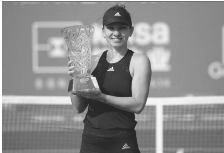
Halep a început excelent anul: a câștigat turneul de la Shenzhen!

„Simona a fost prea bună”. Adversara Simonei, elvețianca Bacsinszky, al cărei tată, Igor, este născut la Baia Mare, a recunoscut superioritatea adversarei ei. „O felicit pe Simona, a fost prea bună pentru mine astăzi” a spus Timea. Statistica jocului relevă neta superioritate a Simonei Halep în ce privește elementele esențiale ale jocului: 80 la sută mingi câștigătoare pe primul serviciu și 61 la sută pe al doilea, față de 60% și, respectiv, 31%, nicio posibilitate de break în dreptul elvețienței, în timp ce Simona a avut 10, din care a fructificat 6, 60 la sută din schimburi câștigate de româncă, față de doar 39 la sută pentru adversara sa. Dincolo de statistică Halep a surprins cu un serviciu mult