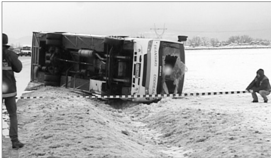
Din ferice doar o persoană a fost rănită ușor în urma răsturnării autobuzului

La fața locului, Inspectoratul pentru Situații de Urgență (ISU) Brașov a intervenit cu trei ambulanțe, însă a fost nevoie doar de una singură, care a preluat-o pe