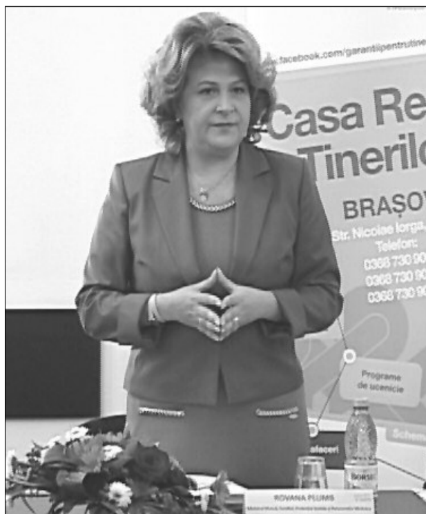
Centrul a fost inaugurat de Rovana Plumb, ministrul Muncii

Deciderea oficială a Casei Regionale a Tinerilor Activi din Brașov s-a făcut în prezența ministrului Muncii și