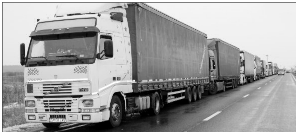
Transportatorii vor fi obligați să majoreze tarifele pentru a recupera pierderile provocate de acciza nerecuperabilă

„UNTRR a atras atenția că excluderea din schema de rambursare a operatorilor economici care se află în procedură de executare silită, faliment, reorganizare judiciară, dizolvare, închidere operațională sau lichidare și adoptarea termenului de două luni pentru aprobarea cererilor de rambursare vor conduce la majorarea tarifelor operatorilor de transport. Transportatorii vor fi obligați să majoreze tarifele cu 15% pentru a recupera pierderile