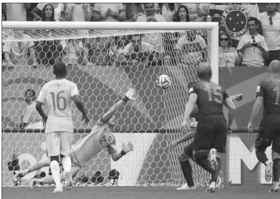
Penaltiul transformat de olandezi în minutul 3 a marcat începutul sfârșitului pentru Brazilia

De-a lungul acestui turneu final, selecționerul Olandei, Louis van Gaal, a folosit toți cei 23 de jucători din lot, o premieră în istoria Cupei Mondiale. Atacantul olandez Arjen Robben a fost desemnat jucătorul meciului Brazilia – Olanda, scor 0-3. Robben a fost integralist și a avut 42 de pase reușite, informează fifa.com. Cu 170 de goluri marcate în 63 de meciuri și încă o partidă rămasă de disputat, Cupa Mondială din Brazilia este la un singur gol de recordul competiției deținut de turneul final din Franța, din 1998, cu 171 de reușite. Media de goluri este de 2,69