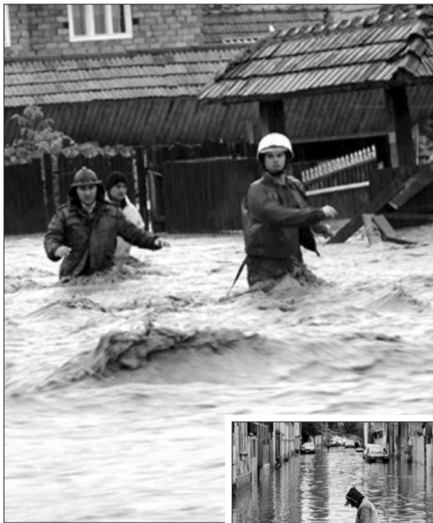
Zeci de localități din sudul țării lovite de viitură