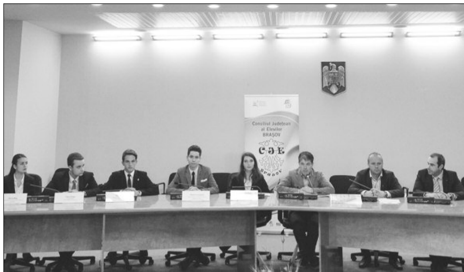
Elevii sunt parteneri cu reprezentanții Primăriei și ai Universității Transilvania