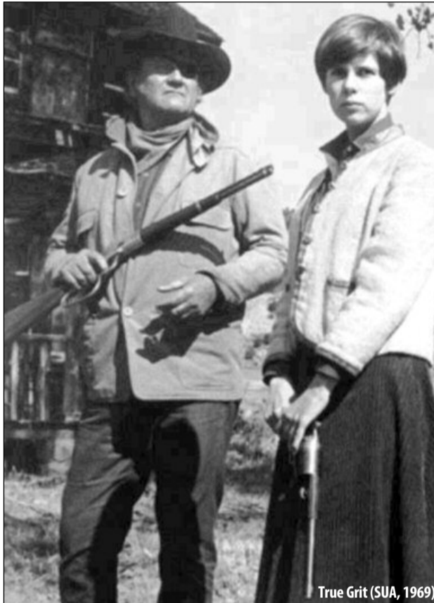
True Grit (SUA, 1969)

19.00. Seară de Oscar: Adevăratul curaj (True Grit) (SUA, 1969)