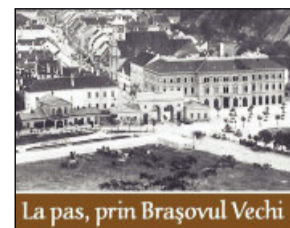
La pas, prin Brașovul Vechi

Proiectul „La pas, prin Brașovul vechi”, prin care autoritățile locale doresc o promovare mult mai bună a monumentelor istorice din centrul vechi al orașului, a început de la 1 iunie. Contra unui bilet de 45 de lei, turiștii pot vizita 17 obiective importante din oraș. De asemenea primesc un pliant de prezen-