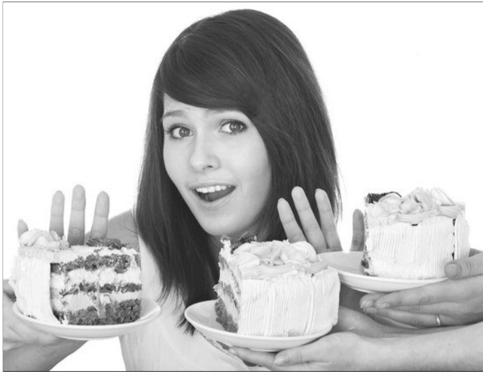
Dulciurile duc la creșterea fulminantă a nivelului de acizi din gură care sunt nocivi pentru smalțul dentar

1. Băuturile dulci. Atunci când bacteriile din gură descompun zaharurile simple, se produc acizi. Acizii demineralizează smalțul dentar și permit formarea cariei dentare. Toate băuturile răcoritoare, inclusiv fresh-urile din fructe constau aproape în întregime din zaharuri simple. Dacă mai sunt și acidulate (carbogazoase), concentrația dăunătoare de acizi va crește și mai mult.