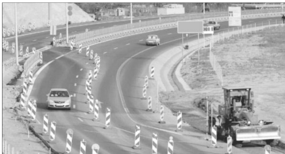
Autostrada Comarnic-Brașov, prima din România care ar urma să fie construită în concesiune

Argumentația principală a forului european este că riscurile de construcție și de exploatare sunt asumate într-o mai mare măsură de partenerul public decât de cel privat. „Nu este vorba de o derogare. EUROSTAT nu dă derogări pentru a introduce sau nu ceva în deficit. A fost vorba de o scrisoare de opinie pe care institutul (nr. INS) a transmis-o la EUROSTAT privind modul de tratare a acestui contract parteneriat de tip public-privat pentru Autostrada Comarnic-Brașov. Noi am făcut o analiză, pe baza contractului, a riscurilor și a modului în care aceste riscuri se împart între