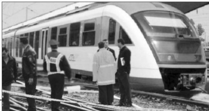
Nimeni nu a fost rănit în timpul incidentului

Conform reprezentanților biroului de comunicare din cadrul CFR Călători, din cauza unei defecțiuni tehnice la un boghiu de la penultimul vagon