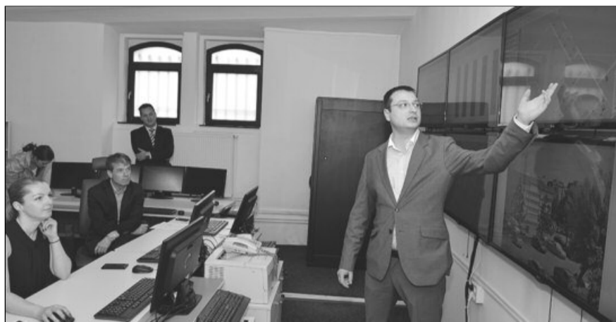
Proiectul este derulat de municipalitate cu fonduri europene nerambursabile

Prima componentă, sistemul de telegestiune, va oferi posibilitatea controlului de la distanță a aprinderii/stingerii punctelor de iluminat, plasate pe 10.481 de stâlpi (pe 399 de străzi), pre-