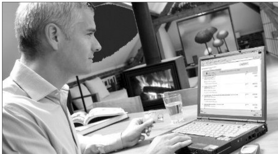
Clientul poate returna produsul, în termen de 14 zile lucrătoare, fără să fie nevoit să dea explicații

De asemenea, directiva prevede pentru consumatori drepturi consolidate în ceea ce privește rambursarea produsului cumpărat, introducerea unui