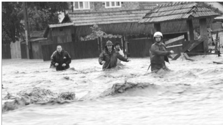
Ploile abundente din ultimele ore au afectat cinci localități din Mehedinți, Gorj, Dolj și Dâmbovița

Viitura a făcut prăpăd în Județul Mehedinți, care se află sub Cod portocaliu. Cantitatea de precipitații a totalizat circa 70 de litri pe metru pătrat până în prezent. Douăzeci de persoane au fost evacuate de către autoritățile care au intervenit prompt în ajutorul celor loviți de inundații. Pompierii au acționat cu pompe speciale pentru a evacua apa ce a pătruns în casele oamenilor, iar printre persoanele evacuate din zonele afectate se numără și copii.