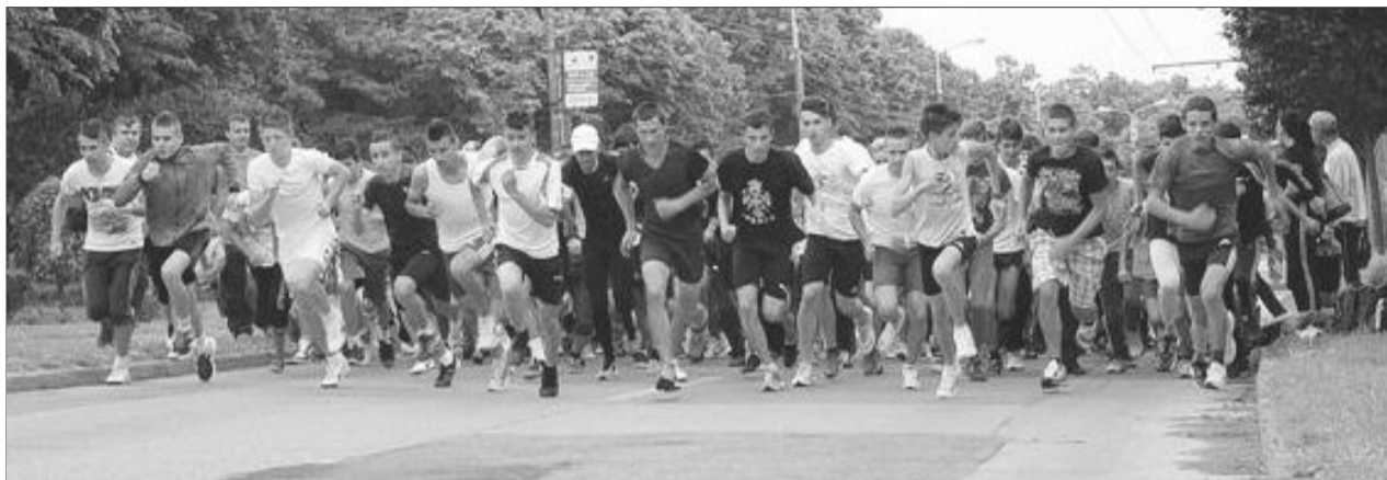
Crosul Tineretului este organizat miercuri în Parcul Tractorul

Evenimentul este organizat de Direcția Județeană pentru Sport și Tineret Brașov și Casa de Cultură a Studenților Brașov, în parteneriat cu Agenția Județeană pentru Ocuparea