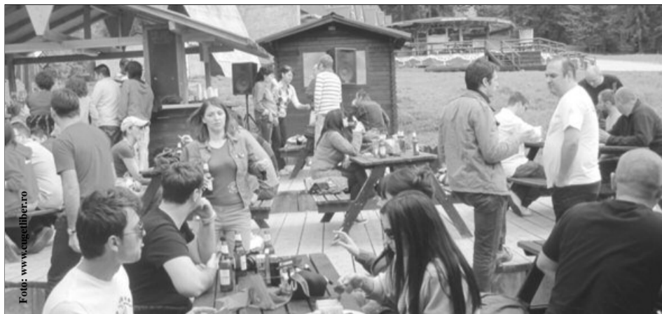
Turiștii au preferat de 1 Mai muntele, iar nu Litoralul

„Dacă inițial erau confirmate circa 35.000 de rezerve, numărul turiștilor care au ales pensiunile s-a dublat pe ultima sută de metri. Este o tendință normală, ținând cont că prognozele meteo inițiale nu au fost cele mai favorabile. Unii turiști au renunțat la alte destinații în favoarea turismului rural, iar alții s-au hotărât cu câteva zile înainte. Pe de altă parte,