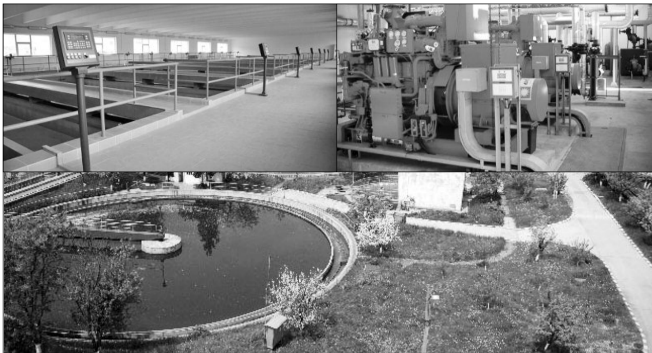
Brașovenii beneficiază de rețele moderne de apă