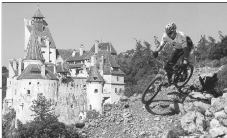
Voluntarii britanici au pedalat în scop caritabil la Dracula Bike Ride

Chiar dacă a plouat, și-au pregătit echipamentul și bicicletele pentru un tur de forță. 50 de kilometri de traseu în zona muntoasă. Pentru acest efort, englezii s-au pregătit, unii