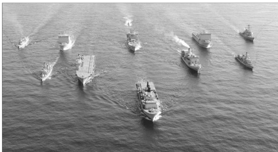
Exercițiile militare au început în Marea Neagră

Exerciții la granița cu Ucraina. De asemenea, Ministerul Apărării Naționale a anunțat ieri că militarii Batalionului