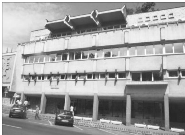
Cursurile sunt organizate lunar de AJOFM Brașov

Studiile necesare în vederea participării la unul din cursurile de formare profesională