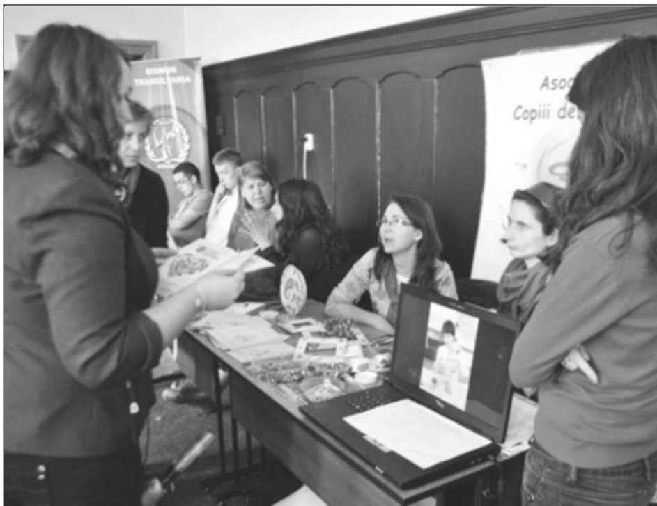
Târg dedicat în exclusivitate celor care doresc să facă voluntariat

Ca și în anii trecuți organizațiile vor avea la dispoziție un stand în care își vor promova proiectele și activitățile, precum și un spațiu comun pentru ateliere și activități demonstrative de voluntariat. O noutate a acest-