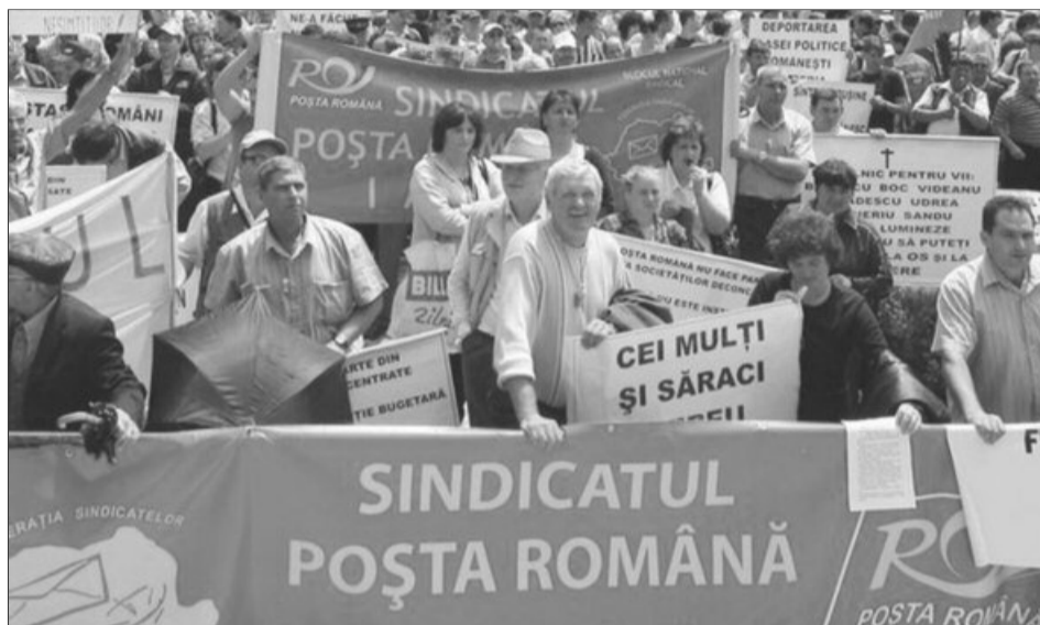
Poștașii cer mărirea salariilor cu 20%

Măști, 13 mai, va fi grevă japoneză în toată țara, iar două zile mai târziu oamenii vor ieși din nou în stradă și vor picheta, de ora 10.00, sediile Oficiilor Jude-