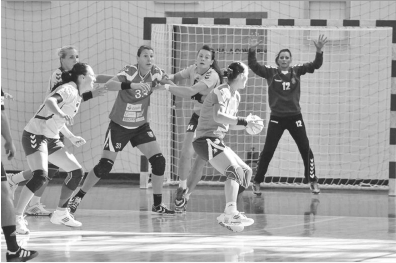
Fetele de la Corona sunt cu un picior în Final 3

Corona a transpirat din greu pentru prima victorie în play-off!