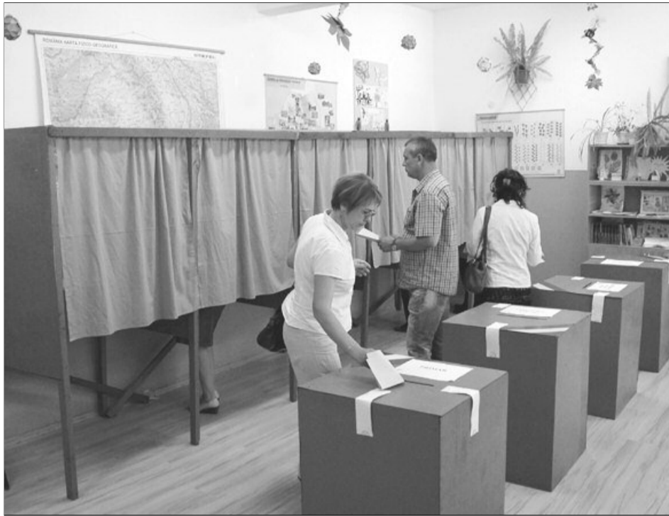
Românii își vor alege europarlamentarii pe 25 mai

„Și tragerea la sorți a președinților secțiilor de votare ar putea avea loc mai repede. În felul acesta ne-ar ajuta foarte mult, pentru că am devansa puțin perioada de instruire a președinților și