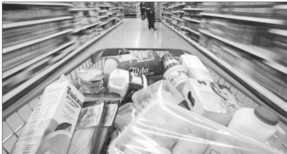
Alimentele proaspete sunt preferatele românilor, potrivit unui studiu

Canalul preferat pentru achiziționarea produselor alimentare proaspete este comerțul tradițio-