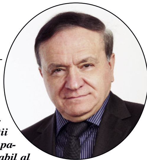
Aristotel Căncescu președintele Consiliului Județean Brașov

Fortificațiile care înconjurau Brașovul medieval și-au recăpătat măreția de odinioară. Am inițiat și am coordonat acest amplu program de investiții menit să pună în valoare patrimoniul istoric inestimabil al Brașovului. Pentru finanțarea lucrărilor, administrația județeană a obținut fonduri externe nerambursabile pentru care a asigurat cofinanțări, însă cea mai mare parte a sumelor a fost alocată din bugetul propriu al Consiliului Județean. Toate lucrările s-au realizat în colaborare cu experți în domeniul monumentelor istorice, fiind avizate de instituțiile abilitate.