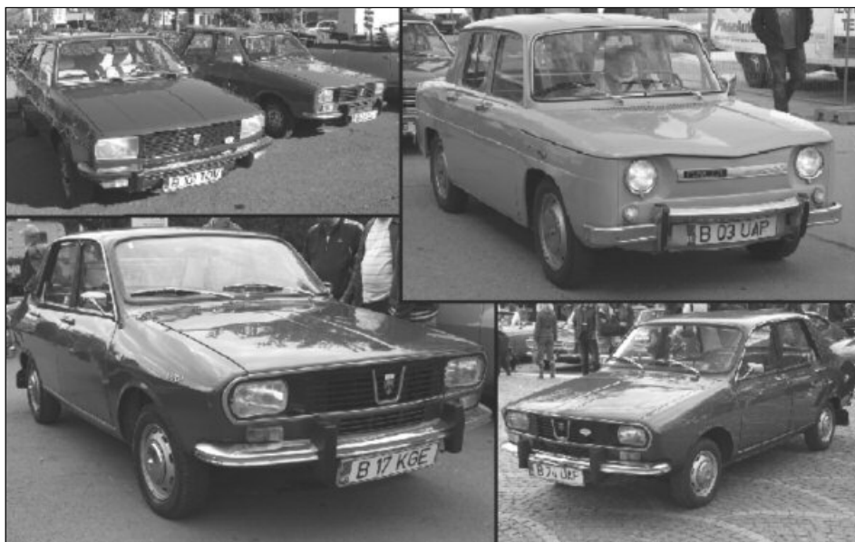
Evenimentul celebrează 45 de ani de la fabricarea primei Dacia 1300 în țara noastră

Peste 50 de mașini, în mare parte Dacia 1300 și Dacia 1100, cu caroseria strălucitoare și motorul în stare perfectă, vă așteaptă să le admirați. Multe dintre ele sunt trecute de 40 de ani, însă nu-și arată vârsta: parcă ieri ar fi ieșit de pe porțile Uzinei de Autoturisme Pitești. O bună parte dintre