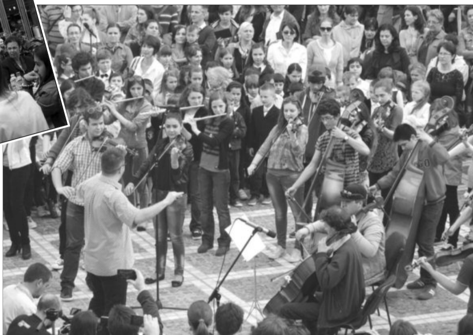
Tinerii au participat activ la serbările legate de „Ziua Europei”