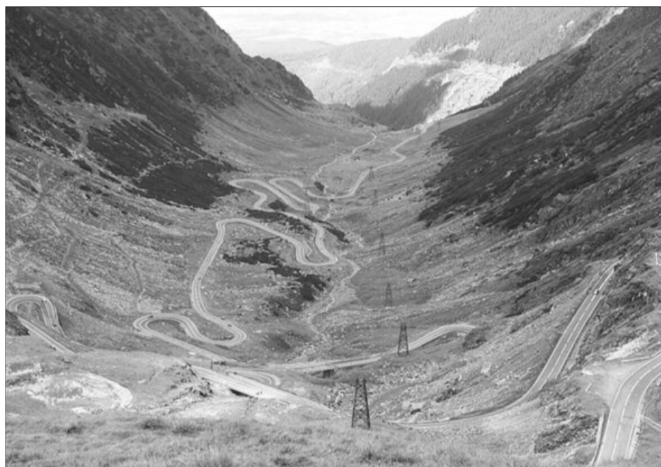
Transfăgărășanul este unul dintre cele mai spectaculoase drumuri din lume

„Pe DN 7C avem un contract de lucrări încheiat pentru 67 de milioane de lei, cu foarte multe lucrări. Pe Transfăgă-