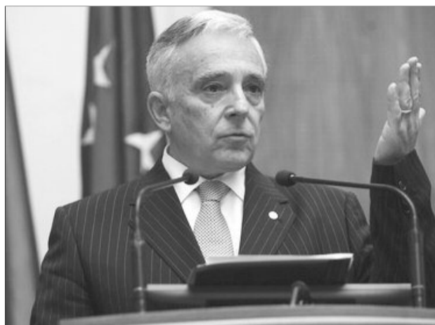
Românii sunt împovărați de plata datoriilor externe, atenționează Isărescu

Guvernatorul a arătat că nu se poate face o legătură între cele două elemente, în condițiile în care se plătește datoria și se ajustează semnificativ deficitul extern. Potrivit guvernatorului, România trebuie să evite politica de rambursare pe care a avut-o Nicolae Ceaușescu. „Nivelul de trai este legat de altceva și trebuie să înțelegi că a face o corelație - avem creștere economică trebuie să crească și nivelul de trai - această corelație nu este valabilă decât dacă toată creșterea economică se duce în nivelul de trai. Or, România, uitați-vă tot la cifre, a redus substanțial deficitul extern. Când ai deficit extern ce în-