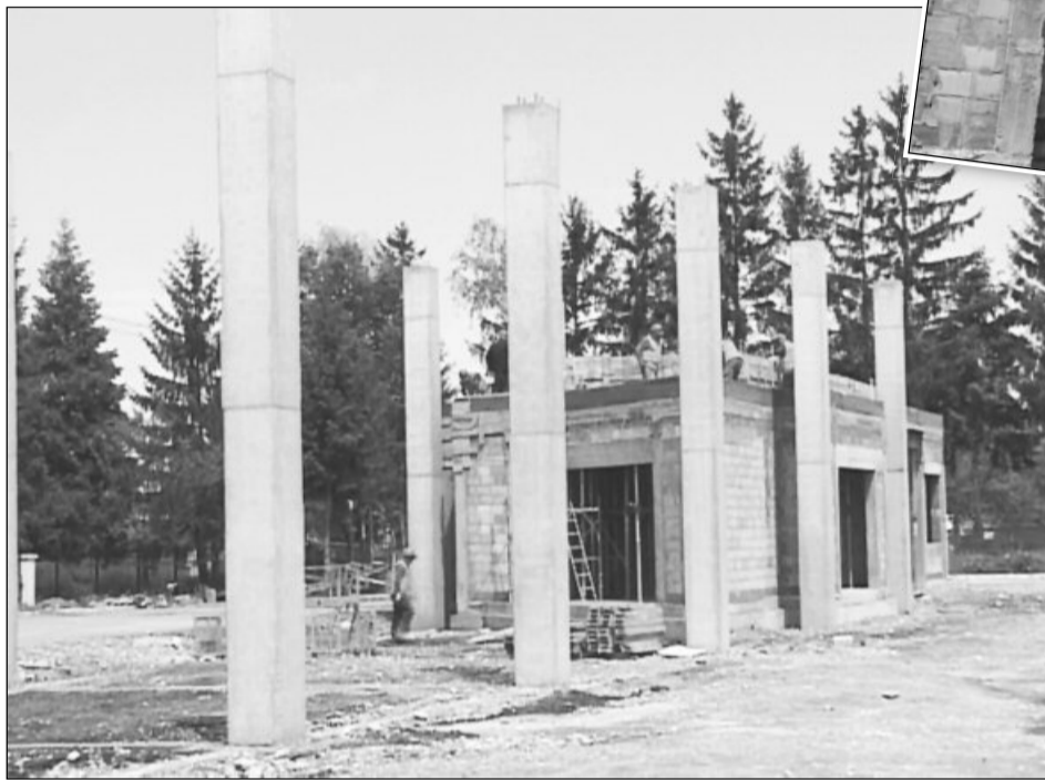
Capetele de linie ale RAT vor fi modernizate complet până în toamnă

Finanțarea se ridică la suma de peste 18,7 milioane de lei, cu o contribuție de la bugetul comunității de două procente.