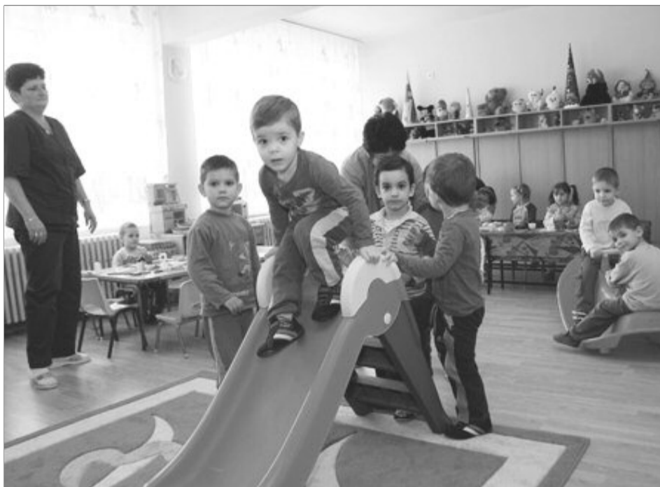
Creșele de stat din Brașov oferă condiții bune de cazare pentru copii

La Brașov există 785 de locuri în creșele publice, iar înscriși sunt 1023. Cea mai solicitată creșă este cea din Răcădău (nr.8), după care cea de pe strada Aurora, din Steagu (nr.4). Din totalul de cereri în așteptare, în toamnă rămân fără loc 218 copii. În creșele de stat, părintele plătește 8 lei pe