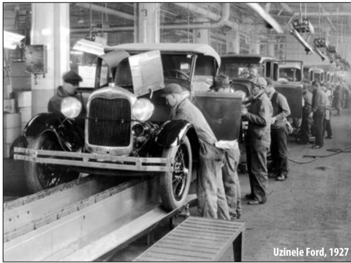
Uzinele Ford, 1927

Adică nu. Statul a avut și el o inițiativă. Să ajute, pe cât poate și el, pe șomerii, dintr'un budget în care veniturile nu pot să facă față cheltuelilor și apoi să îndemne comunele și județele să facă la fel. Nu și-a dat însă seama că golul pe care-l produce în economia țării brațele ce stau inactive n'are să poată permite mult timp această ajutorare și că atunci când se va face trista constatare, cei amenințați de