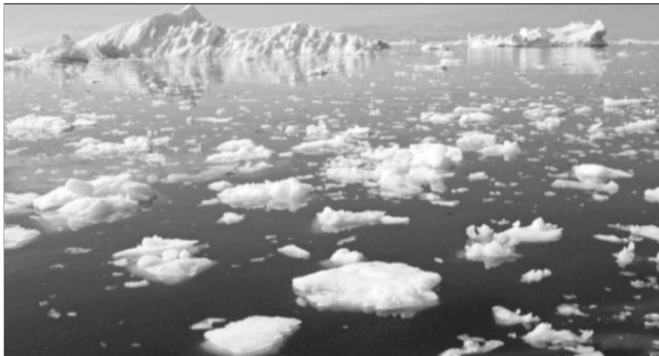
Specialiștii avertizează că topirea ghețarilor va ridica nivelul apelor cu peste un metru la nivel global