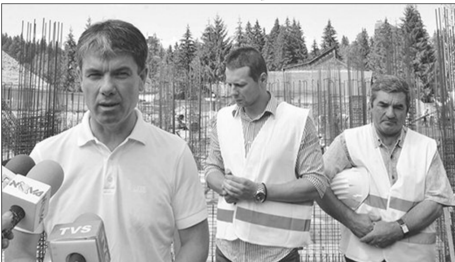
Primarul George Scripcaru inspectează stadiul lucrărilor

Investiții în turism. Turismul va reprezenta, în continuare, unul dintre punctele de dezvoltare pentru Municipiul Brașov. Astfel, în perioada 2008 - 2014 au fost atrase fonduri pentru dez-