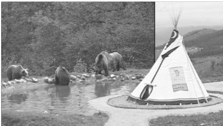
Rezervația este singurul loc din țară unde copiii vor putea petrece o noapte în natură alături de urși