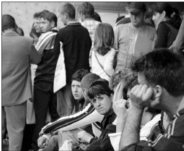
Cei mai mulți șomeri provin din rândul celor fără studii

Serviciile de care au beneficiat persoanele încadrate în muncă sunt: medierea muncii,