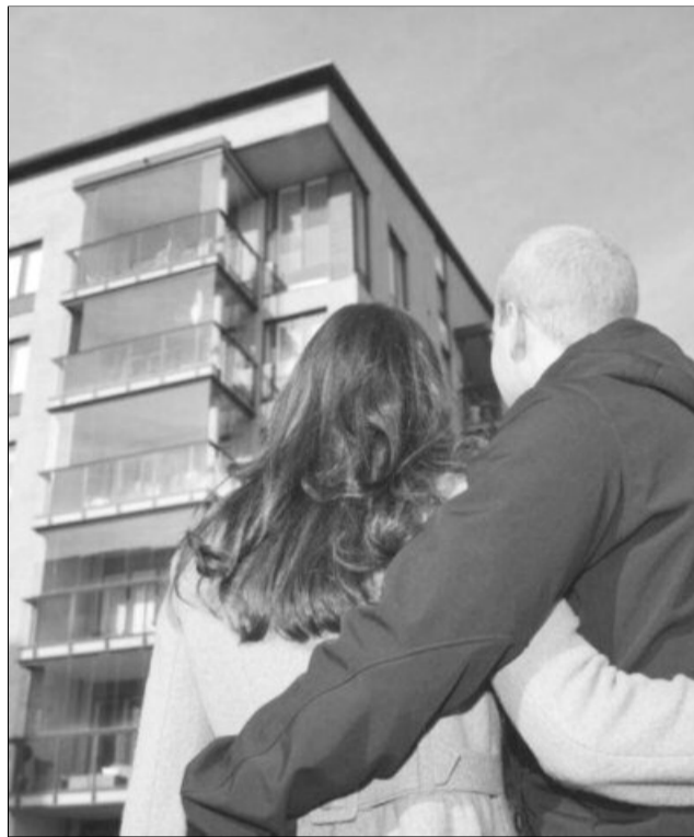
Majoritatea tinerilor își cumpără o locuință prin programul „Prima Casă”

Potrivit unei analize realizate de portal pe baza căutărilor efectuate la nivel național în luna aprilie, 66% dintre vizitatori caută un apartament cu un preț maxim de 60.000 de euro. Mai exact, 16% dintre potențialii cumpărători și-ar dori o locuință care să coste cel mult