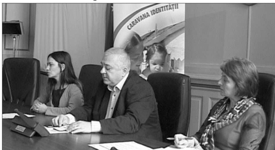
Dacă nu ai act de identitate sau de domiciliu, nu ai acces la servicii conform legii, spun reprezentanții proiectului

Caravanele se vor desfășura pe parcursul a opt luni de zile, procedurile de întocmire a actelor fiind în unele cazuri destul de greoaie și asta pentru că există persoane care nu au nici măcar certificate de naștere ori nici nu știu cu exac-