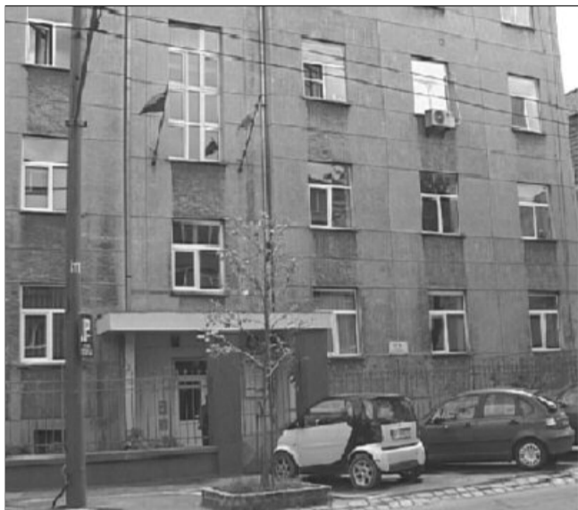
Pentru Brașov ar fi fost un mare câștig dacă unitatea medicală și gara ar fi fost administrate pe plan local, iar nu de la centru

În iulie anul trecut, Consiliul Județean Brașov a solicitat oficial Ministerului Sănătății preluarea Spitalului CFR, în contextul în care au fost demarate lucrările la reabilitarea