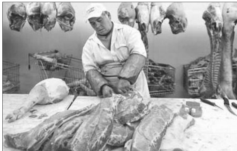
Patronatele fac lobby pentru reducerea tva la produsele din carne

Potrivit acestuia, pe termen scurt, bugetul de stat ar putea avea de suferit de pe urma diminuării încasării sumelor aferente TVA-ului, dar există mai multe soluții pentru a compensa acest ecart. „Propunem autorităților