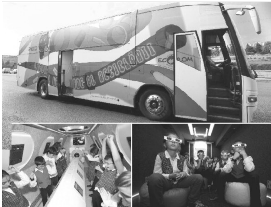
Laboratorul Verde al Reciclării este un autocar modificat și adaptat pentru mințile curioase și inventive ale copiilor

Laboratorul Verde al Reciclării este un laborator mobil, adaptat preferințelor copiilor, unde ficțiunea și realitatea se suprapun de-a lungul a trei zone de activare: sala de cinema 3D – unde elevii urmăresc aventura a 5 deșeuri de ambalaje către fabrica de reciclare, zona de joc în echipă pe tablete PC – unde aceștia trebuie să colecteze separat cât mai multe obiecte în containerele corecte și cubul magic al reciclării – unde experimentează mecanica reciclării. La finele fiecărui semestru școlar, clasa cu cel mai