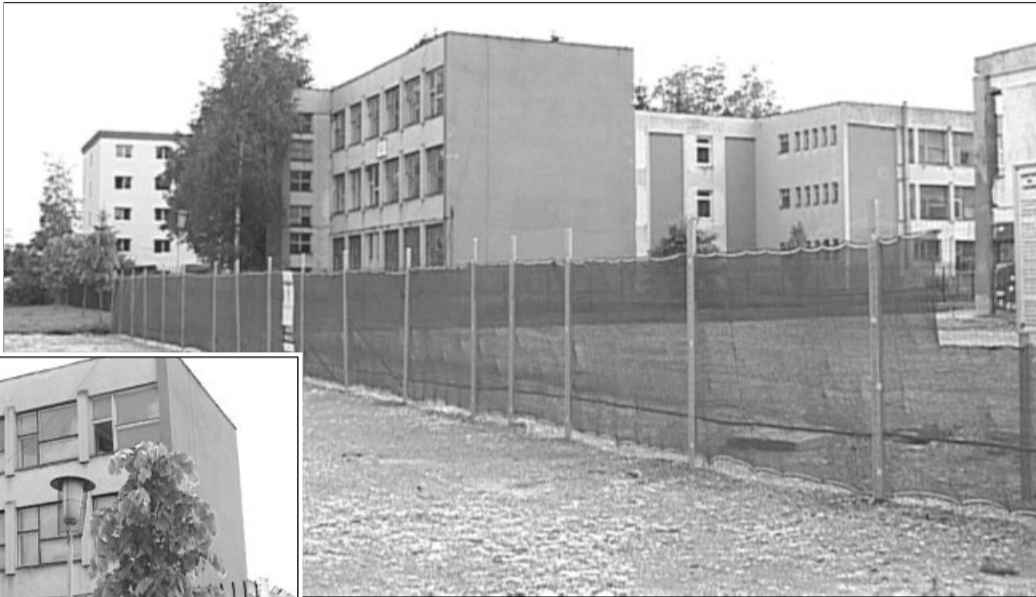
44 de familii aflate în situații dificile ar trebui să se mute la iarnă în noile locuințe

Blocul social de pe strada Zizinului trebuie să fie gata până în noiembrie, conform contractului semnat între firma care a câștigat licitația de construire a imobilului, și administrația lo-