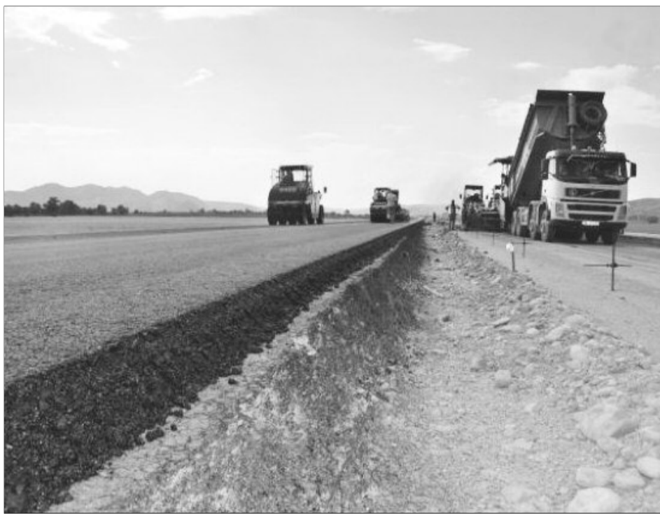
Cea mai așteptată autostradă din România: Comarnic-Brașov

La începutul acestei luni, însuși ministrul Transporturilor,