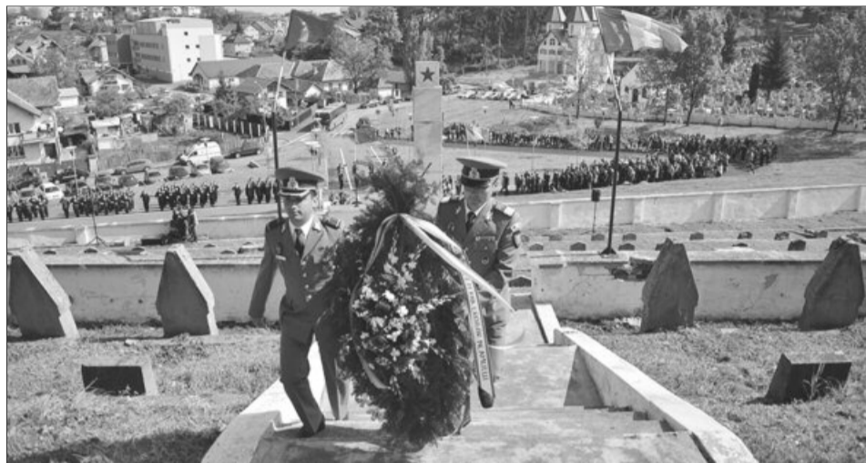
Brașovenii nu și-au uitat eroii

De asemenea, tot astăzi, Asociația Luptătorilor, Răniților și Urmașii Eroilor „Brașov-December 1989” invită toți cetățenii Brașovului, începând cu ora 11,00 la Cimitirul Eroilor Revoluției din Decembrie 1989 Brașov. Aici se va desfășura un Ceremonial religios, depunere de coroane, jerbe și buchete de flori în cinstea Eroilor