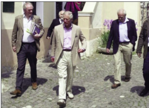
Prințul Charles la Prima școală românească

Prințul Charles a sosit marți într-o vizită privată în România. După un scurt popas în localitatea Viscri, unde deține mai multe proprietăți, a plecat spre localitatea covășneană Micloșoara, de lângă Baraolt, unde a petrecut prima noapte la prietenii săi, familia contelui Kalnoky. Aceasta fiind una dintre destinațiile favorite.