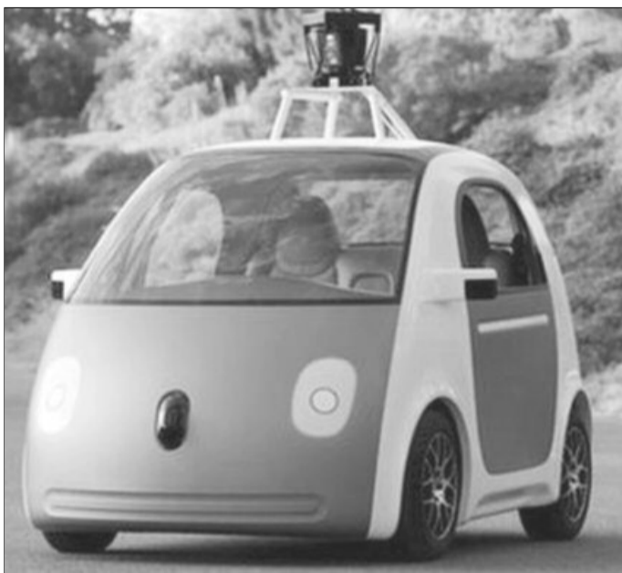
Americanii vor crea mașina fără volan, fără pedala de accelerație și fără frâne

Compania a lucrat până în prezent la mașini fără șofer echipând autovehicule existente pe piață cu tehnologia pe care a dezvoltat-o în acest scop. Google afirmă că mașinile au-