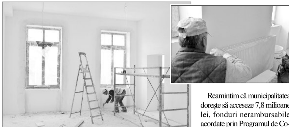
Investițiile în infrastructură sunt necesare

Lucrările cuprind, în funcție de proiect, reparații sau înlocuiri ale instalațiilor de încălzire și centralelor, anveloparea clădirilor și izolarea termică a fa-