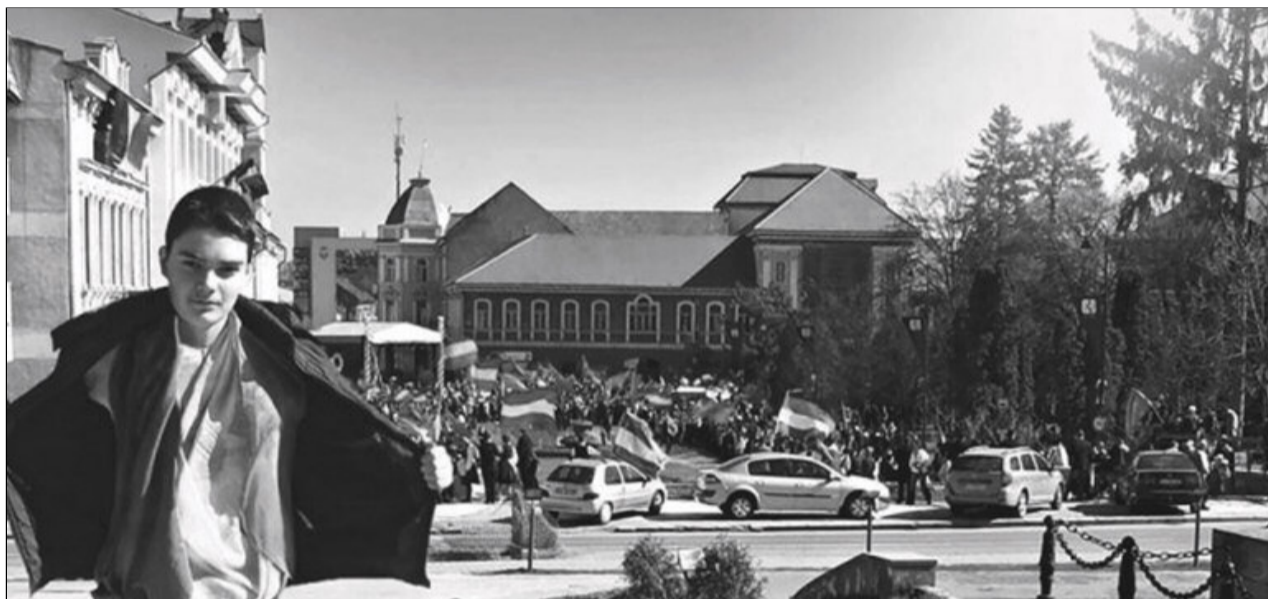
Gestul tânărului a fost considerat provocator de către unii etnici maghiari

Printre cei peste 900 de utilizatori ai rețelei care au comentat pro și contra fotografia se numără câțiva de etnie