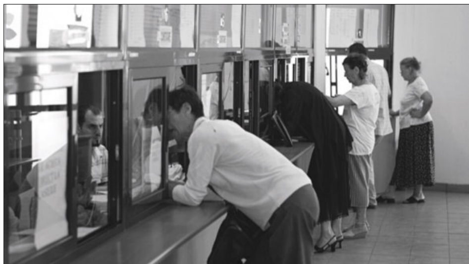
Contribuabilii nu ar mai trebui să piardă timpul la coadă pentru plata taxelor

Ea a amintit, în acest context, planul cu Banca Mondială, demarat la sfârșitul anului trecut, de modernizare a ANAF și intenția de plafonare a plăților în numerar. „În plus, avem nevoie de o direcție de analiză de Risc în cadrul ANAF care să fie performantă, obiectivă, computerizată, pentru a eficientiza modul de colectare și de control în cadrul ANAF”, a mai spus mi-