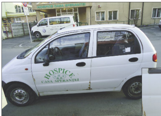
Hospice are nevoie de o mașină nouă

Cei care doresc să participe la Semimaratonul Brașovului pot alege să devină fundraiseri pentru HOSmașina, accesând www.semimaraton.ro/2014/