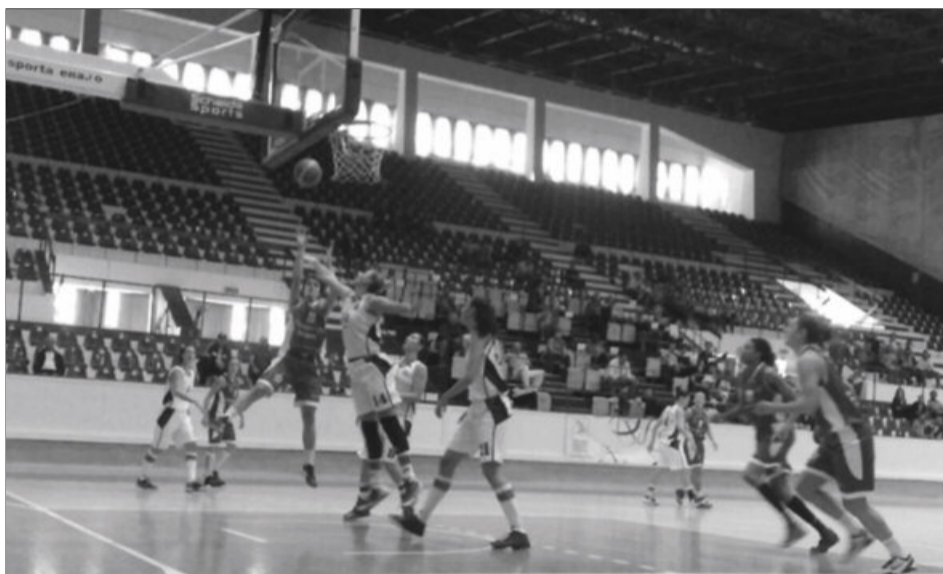
„Olimpicele”, la ora ultimului test înainte de înainte de play-off