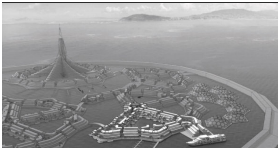
În Hong Kong, există întregi cartiere plutitoare, realizate după anii '80, pentru populația în creștere

De altfel, arhitectul de origine nigeriană Kunle Adeyemi propune o serie de case plutitoare tip cadru pentru Lagos. Ca do-