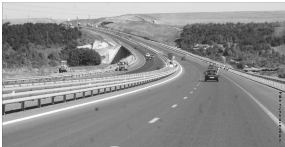
În topul priorităților pentru finanțare se află autostrada București-Brașov

Pe locul secund pentru acest an este tronsonul de autostradă București-Ploiești-Brașov. Pe tronsonul București-Ploiești, autostrada nu este nici acum terminată, la mai bine de doi ani de la tăierea panglicii, scrie economica.net . Pentru această parte a autostrăzii, finanțarea este în acest an de 280 de milioane de lei. Pentru exproprierea de pe tronsonul Comarnic-Brașov, care ar urma să fie construit în sistem de concesiune de consorțiu Vinci-Strabag-Aktor, alocația pentru acest an se ridică la 149 de mi-