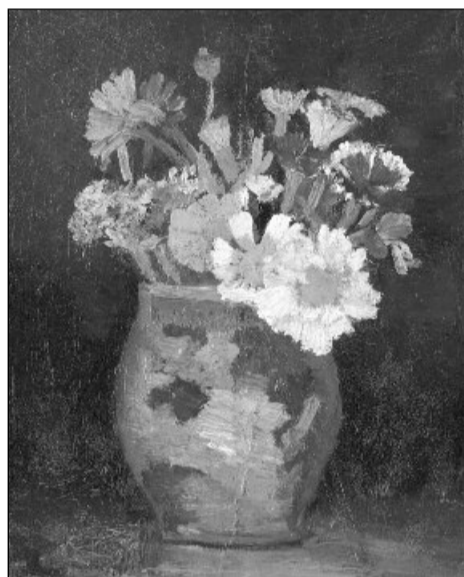
Ion Andreescu – Ulciică cu flori de câmp

Expoziția reunește capodopere semnate de reprezentanți de seamă ai picturii românești din secolele XIX-XX (Ion Andreescu, Ștefan Luchian, Gheorghe Petrașcu, Theodor Pallady, Nicolae Tonitza, Iosif Iser, Corneliu Baba, Ștefan Câlția, Sorin Ilfoveanu etc.).