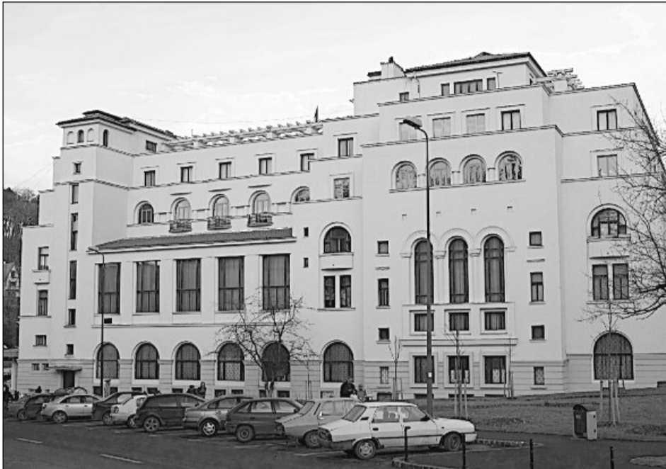
Casa Armatei, locul de debut al „Galei tinerilor concertişti” din 1986

În perioada 28-30 martie 1986, în frumoasa sală a coloanelor Casei Armatei, vor fi răsunat „acorduri minunate, întretesute cu fireștile emoții ale tinerilor participanți”. Vor fi prezenți 12 „aspiranți” la grațiile zeiței Euterpe, din București, Cluj-Napoca, Iași, Constanța, Tg. Mureș și, bineînțeles, din orașul gazdă, „tineri de talent”, laureați în Festivalul Național „Cântarea României” (cum altfel?! n.n.),