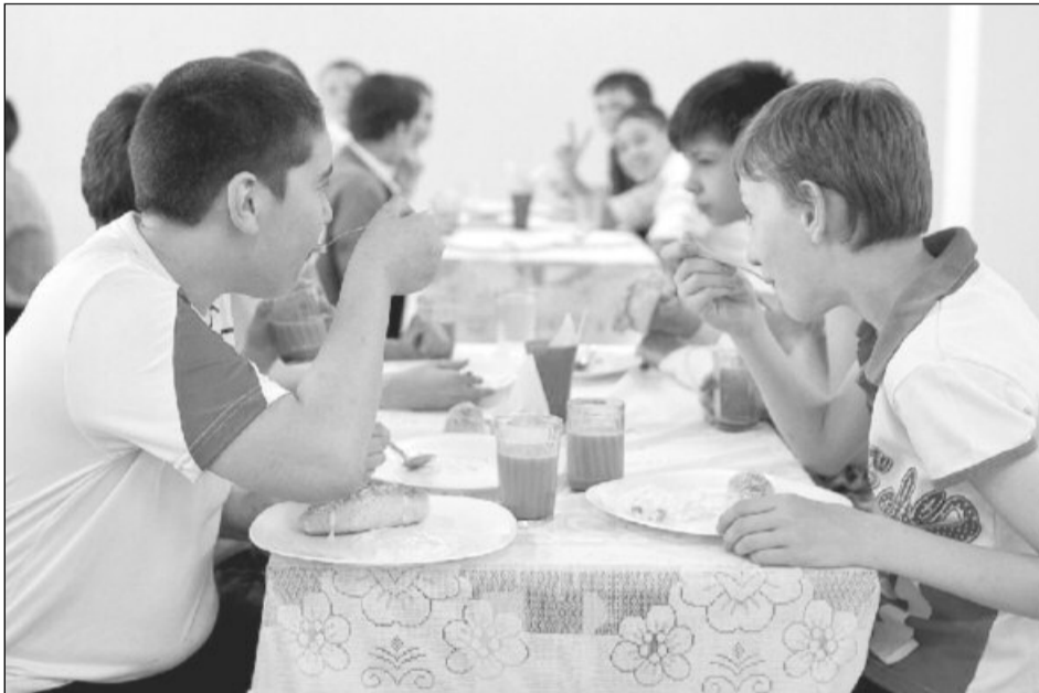
O alimentație deficitară crește riscul de anemie în rândul copiilor

Medicii precizează că necesarul de fier variază în funcție de vârstă, sex, anumite stări biologice (sarcină, menopauză, etc), iar co-