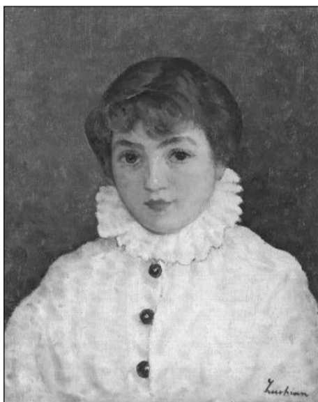
Ștefan Luchian – Pierrot