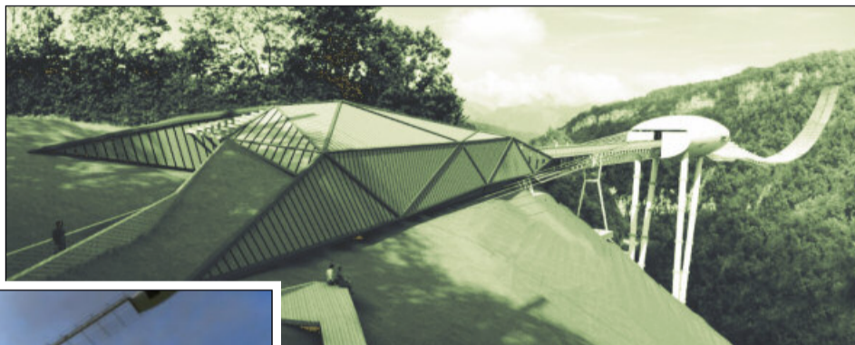
Podul a fost inaugurat în stațiunea rusească din Soci

Cel mai lung pod pietonal suspendat din lume, de 439 de metri, se găsește la Soci, în Parcul Național al acestei stațiuni din Rusia, care a găzduit Jocurile Olimpice de Iarnă din acest an.