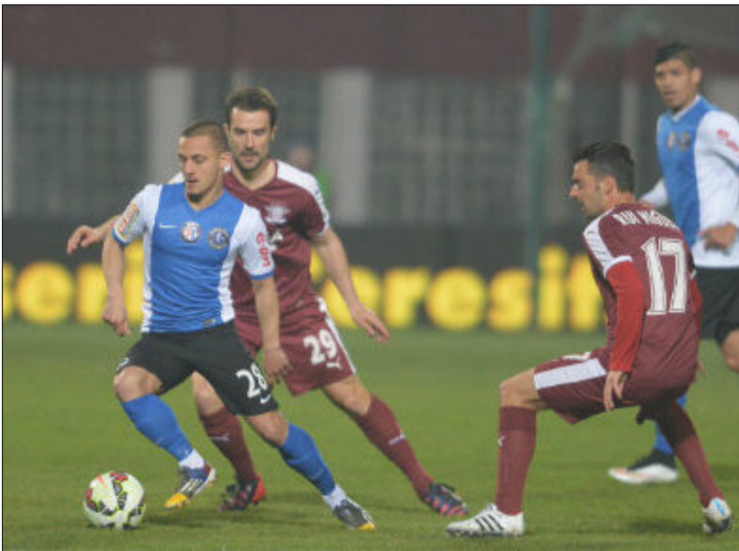
Rapidul nu a deraiat luni seară, chiar și cu doi oameni mai puțin în teren!